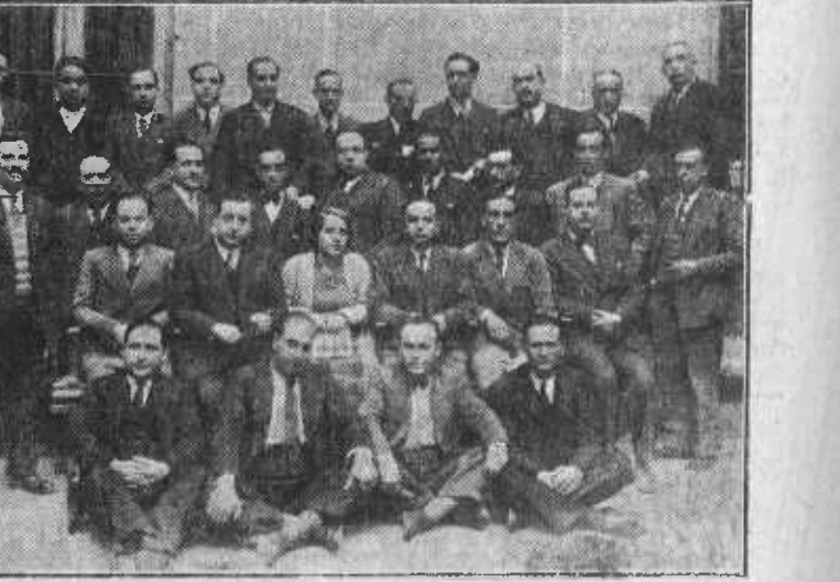
Asistentes a la Asamblea de la Federación Regional de Cooperativas del Centro de España.