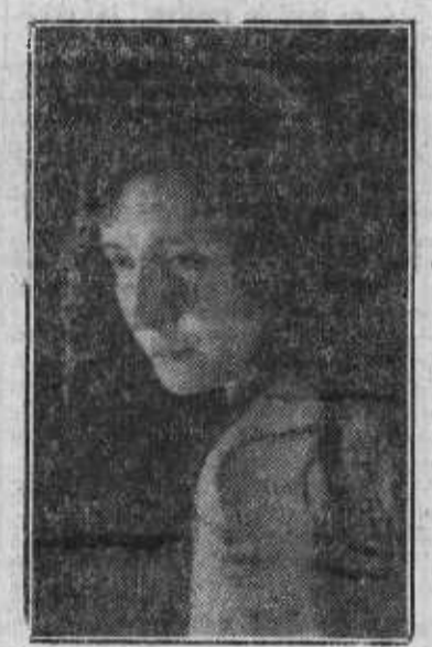
Carmen Vianco, la bella artista española de la pantalla.