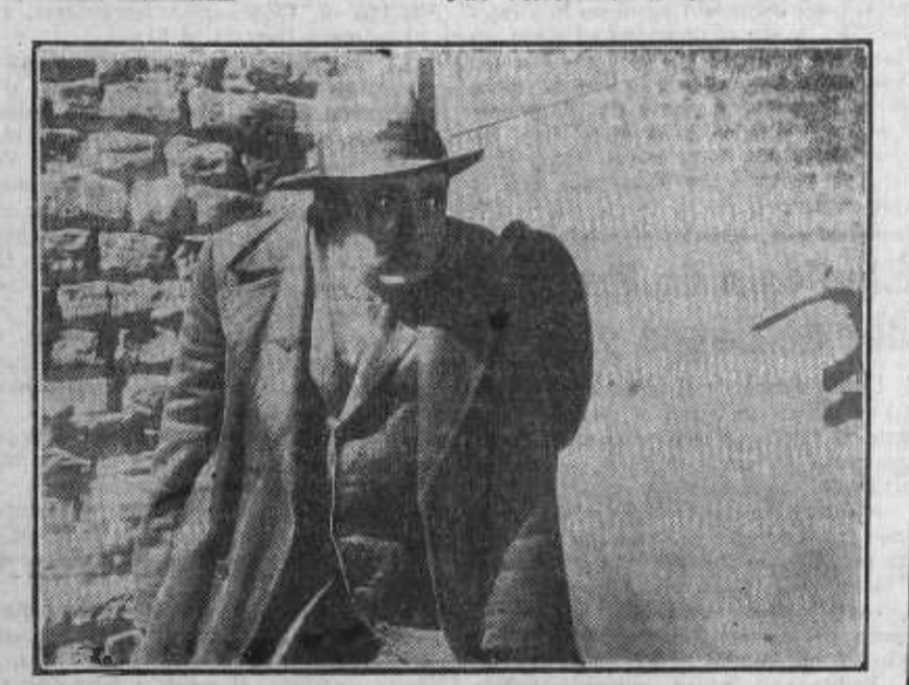
El famoso vampiro de Dusseldorf, que interpreta el film «M», para ver el cual aumenta de día en día la expectación.

Una escena de «El cantor desconocido», que pronto veremos en Madrid.