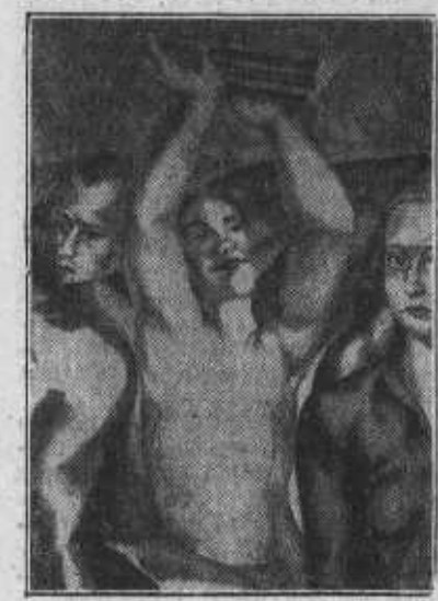
Detalle de uno de los frescos que ha hecho Luis Quintanilla para la Casa del Pueblo.

Otros conceptos equivocados en ese hombre que levanta un pequeño trozo de cornisa, y para ello realiza un esfuerzo sobrehumano, que dijérase de un atlante; en la manera de pegar los ropajes a algunas figuras femeninas, no a la manera de algunos escultores griegos y de nuestro Romero de Torres, que desnudaban a las mujeres haciendo que el viento, soplando los vestidos, acusen las formas femeninas, sino introduciéndolas materialmente entre los muslos y las nalgas hasta provocar