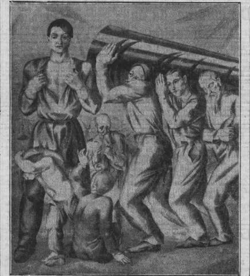
Un aspecto de uno de los frescos del salón grande de la Casa del Pueblo, por Luis Quintanilla.

Y, una vez advertido esto, tratemos de los paños pintados al fresco que