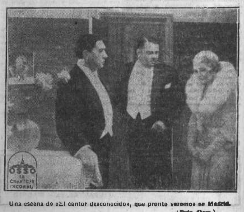
Una escena de «El cantor desconocido», que pronto veremos en Madrid.