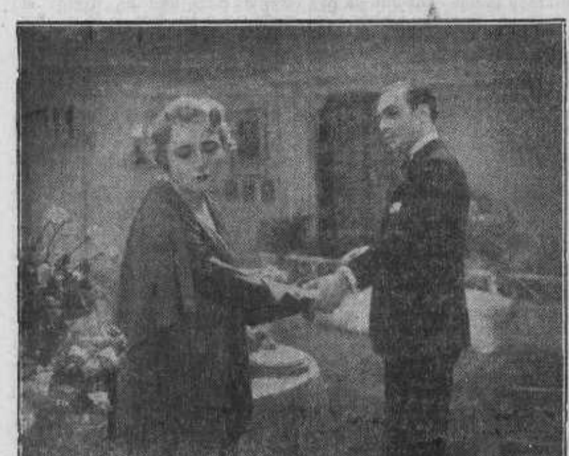
Simone Gerdan y Charles Boyer en «El incendio de la Ópera».

Todo aquel—particular o empresa—cuya actividad se consagra al cine o al teatro recibe esta número de EL SOCIALISTA, que es el periódico leído por el pueblo. ¡No lo olvidéis!