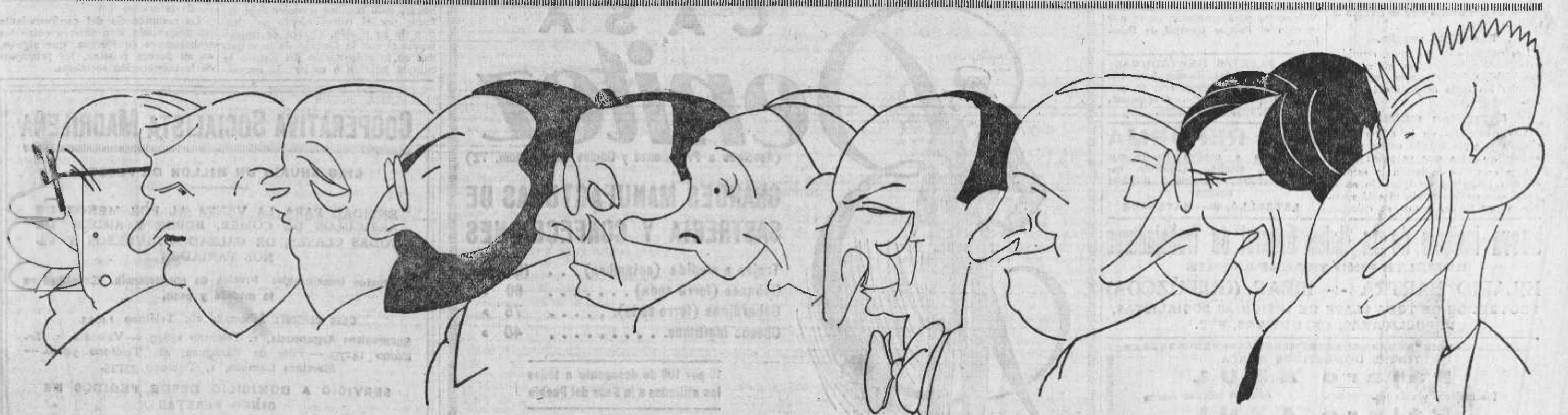
EL NUEVO GOBIERNO (de izquierda a derecha). — Azaña, Presidencia; Carner, Hacienda; Prieto, Obras públicas; De los Ríos, Instrucción pública; Giral, Marina; Albornoz, Justicia; Casares Quiroga, Gobernación; Largo Caballero, Trabajo; Domingo, Agricultura, y Zulueta, Estado.

de las autoridades locales de la enseñanza. Para su tectura y explotación en las escuelas nacionales, el Gobierno ha repartido un millón de ejemplares de la Constitución de la República Española. Sabemos de una gran mayoría de maestros, fieles cumplidores de su deber, que con todo entusiasmo llenarán su misión; pero también sabemos de una minoría con resabios cavernícolas dispuesta a hurtar al conocimiento de los niños las leyes fundamentales de su patria. Llamados a velar por su cumplimiento en las escuelas están los Consejos locales y los inspectores de Primera enseñanza. Y entre uno y otros los hay beneméritos colaboradores de la revolución y «reventadores» vergonzantes. Que la conciencia ciudadana esté siempre despierta para cordial estímulo de los unos y alerta vigilante de los otros.