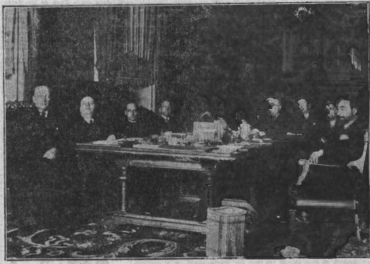
El nuevo Gobierno, presidido por el señor Azaña, celebra su primer Consejo de ministros

Toda la atención de Polonia se concentra en la preparación de su ejército. En los campos se puede ver cómo son adiestrados los soldados para un rendimiento máximo. Hemos podido ver, primero, cómo se obtiene el soldado en las aldeas, encuadrándolo entre sergentes encargados de conducirlo al cuartel; después ese mismo soldado, equipado con sus arcos bélicos, estirado dentro de su uniforme, juega a la guerra disparando su fusil contra siluetas de madera, o hace guardias inacabables en la frontera, temeroso de que irrumpa por ella la