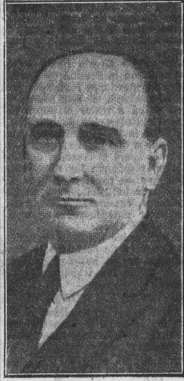
Los camaradas Fernando de los Ríos, Indalecio Prieto y Francisco Largo Caballero, que serán juzgados, con los demás firmantes del manifiesto revolucionario, en el Consejo de guerra que hoy comenzará sus sesiones.