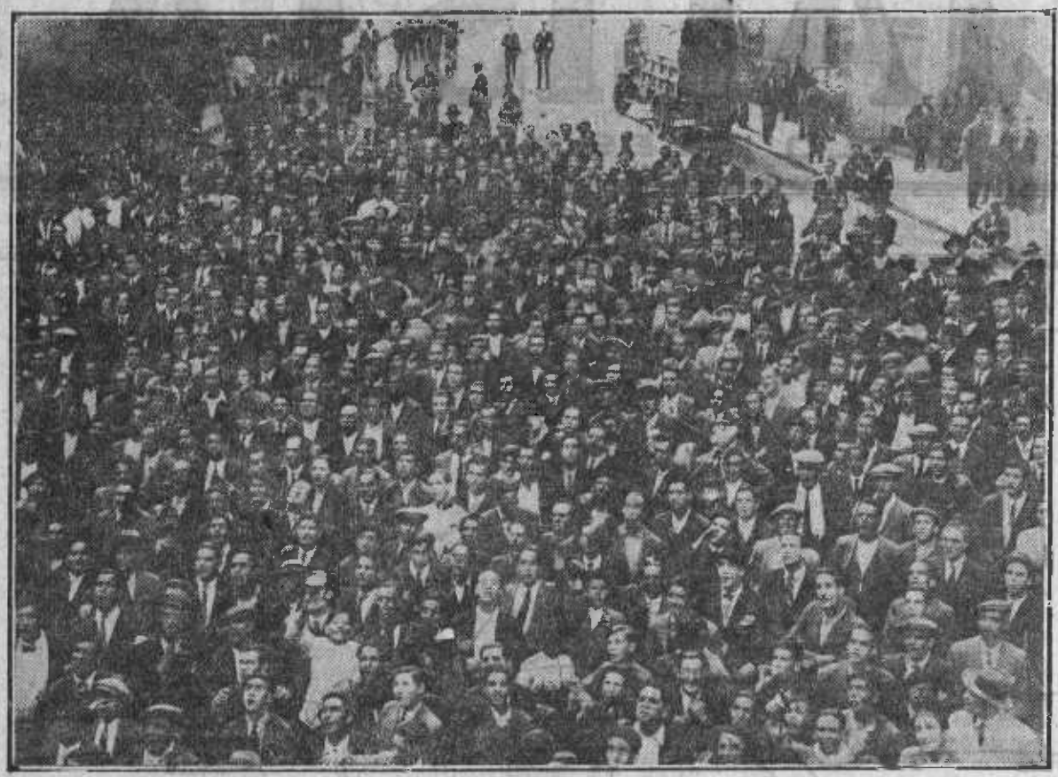
Aspecto de la multitud congregada en la plaza de la Villa el día 14, momentos después de haber sido proclamada la República.