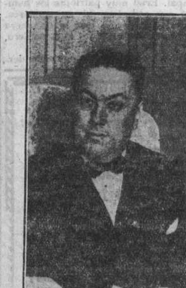
MARTINEZ BARRIOS Comunicaciones.