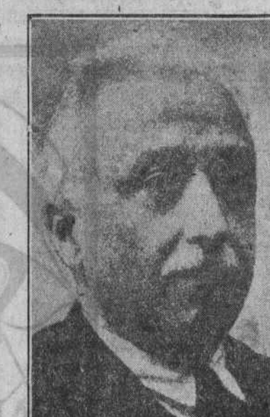
ALCALA ZAMORA Presidencia.