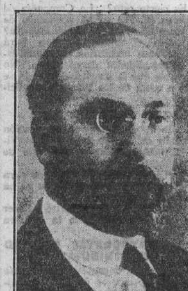
FERNANDO DE LOS RIOS Justicia.