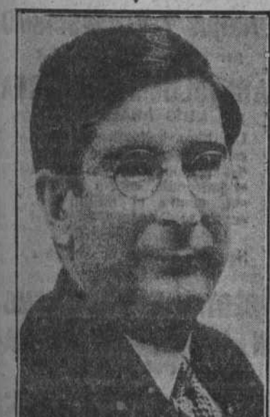
MARCELINO DOMINGO Instrucción pública.