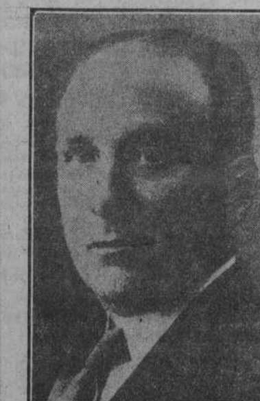
LARGO CABALLERO Trabajo.