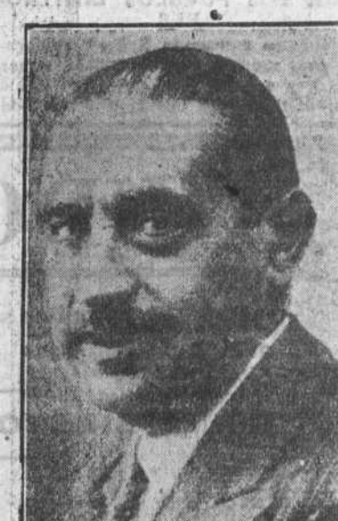
MIGUEL MAURA Gobernación.