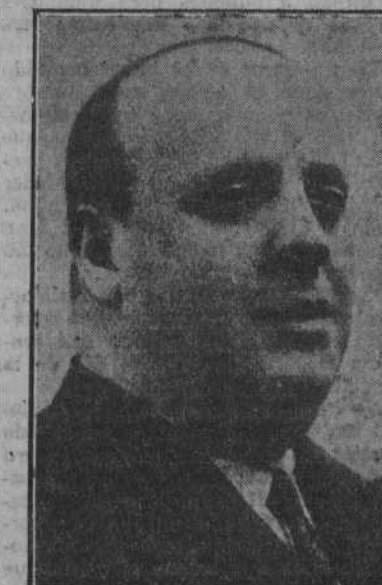
INDALECIO PRIETO Hacienda.