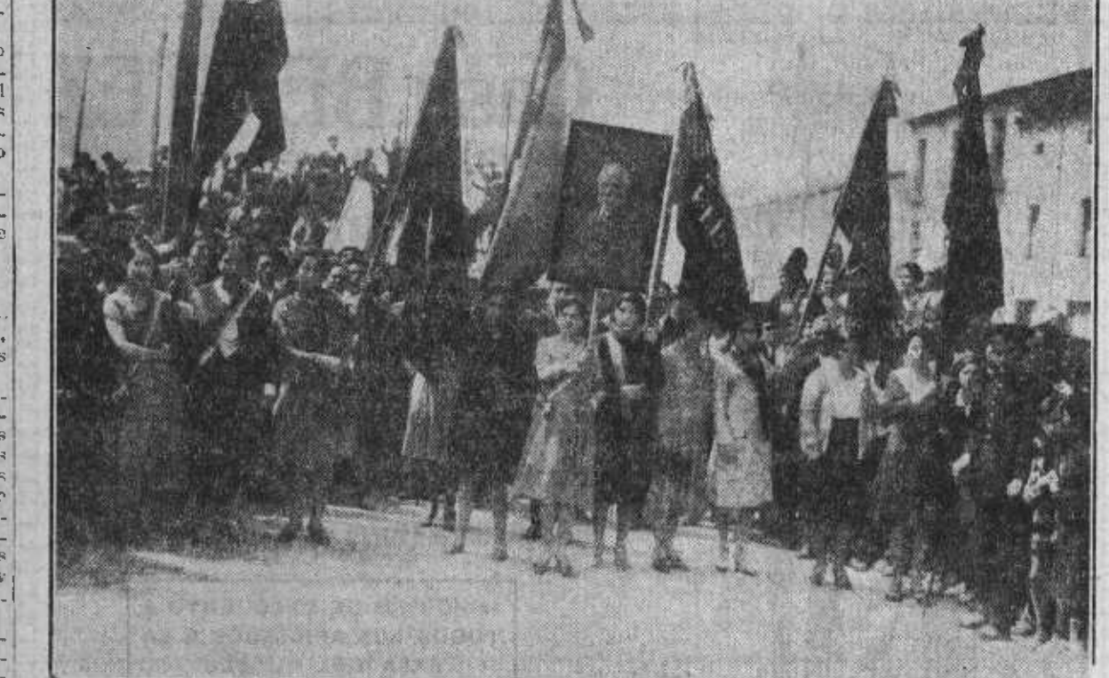
Jóvenes compañeras de Cahorra que llevaron en la manifestación las banderas de las So.