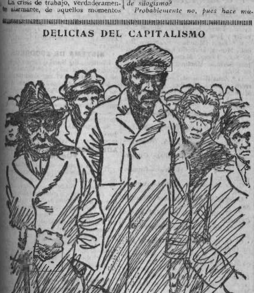
El cortejo triste y dolorido de los sintrabajo.