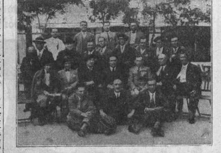
Los delegados al Congreso de los Obreros y Empleados de las Juntas de Obras reunidos en fraternal almuerzo.