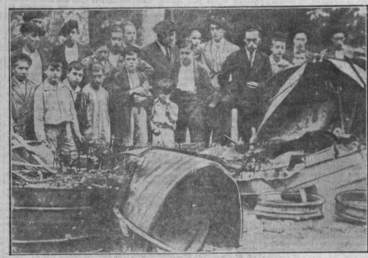
Restos del auto incendiado en Vergara (Guipúzcoa) y en el que iban eibarreses de las derechas.