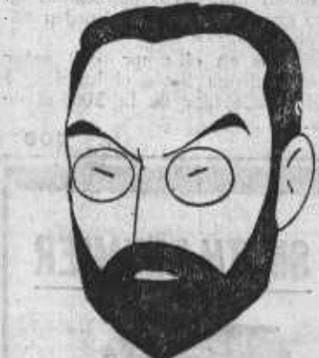
FERNANDO DE LOS RÍOS

Seguramente ese día quedarán desvanecidos en el consejo todos los equívocos que se han suscitado en la