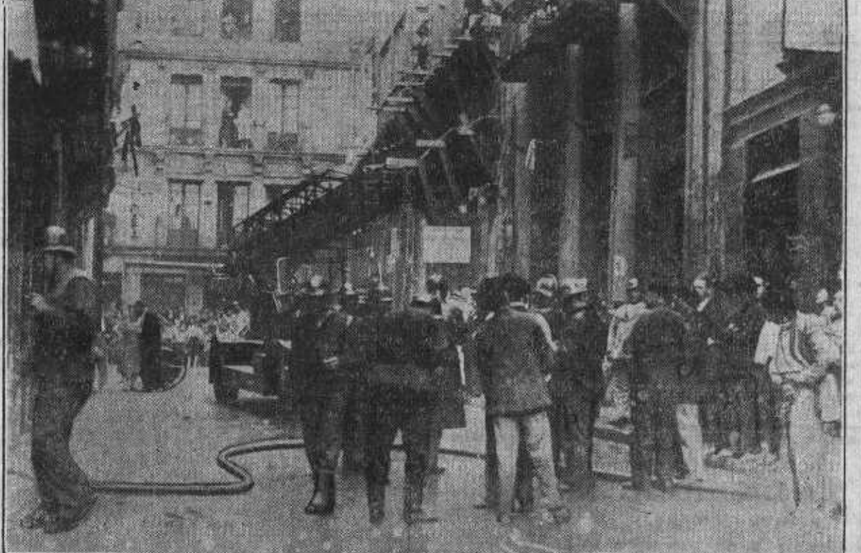
BILBAO. — Los bomberos sofocando el incendio que amenazaba destruir una casa de la calle de La Laguna.