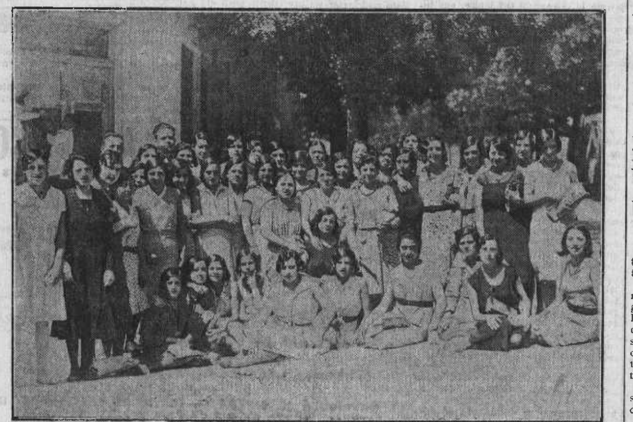
Un grupo de simpáticas obreras de la fábrica de pañuelos.

Al lado de «El Imperator». Duques de Alba, 6. Muebles barrocos, inmenso surtido en camas doradas, hierro,