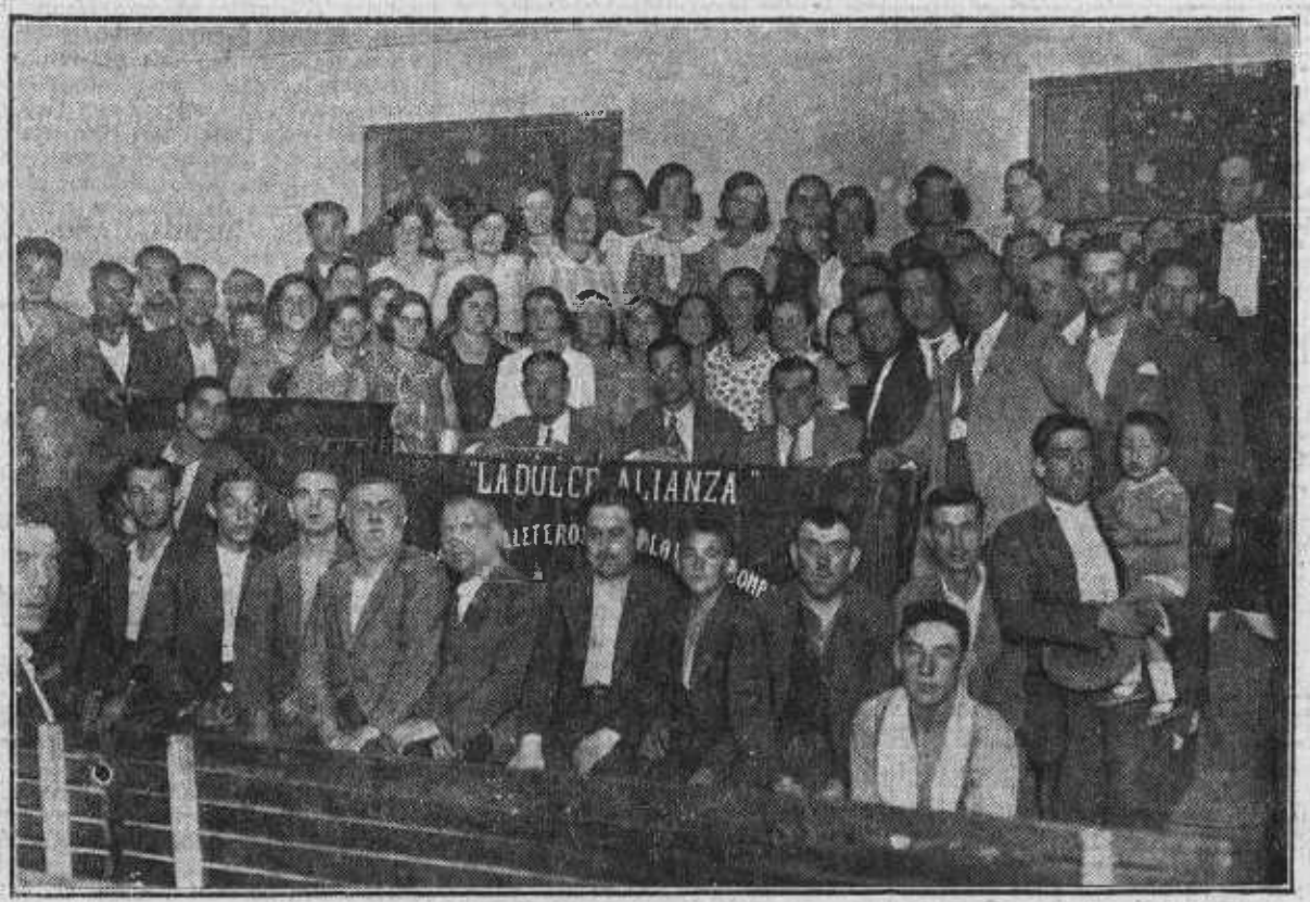
Grupo de concurrentes al acto de propaganda sindical organizado por el Sindicato de Artes Blancas (Sección Galleteros).

No presume de tan alto abuelengo este Luzbel modesto que han apreado en Barcelona. No lo queremos tampoco suponer cómplice de los reaccionarios. Es un muchacho comunista. Hacía, por lo visto, diablos sociales alrededor de no sabemos qué cigarreras. (Luzbel siempre detrás de la manzana.) Y ha dado con sus herreros en la cárcel... Levemente en la cárcel. Como el Luzbel de Barahona. Para escaparse o salir en seguida y seguir haciendo de las suyas. Ayudar a ir tirando a todo el más viejo y divino ángulo de este mundo, a ser la levadura agria de las creencias, los mitos y las preocupaciones, que no se resignan a abdicar y hacer mutis definitivo.—J. M.