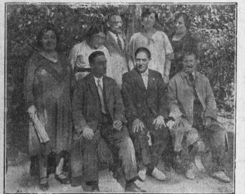
Los profesores de la Colonia escolar de los Viveros de la Villa en un momento de descanso.

La noticia ha causado descontento entre los monárquicos de esta ciudad y gran regocijo entre las izquierdas.