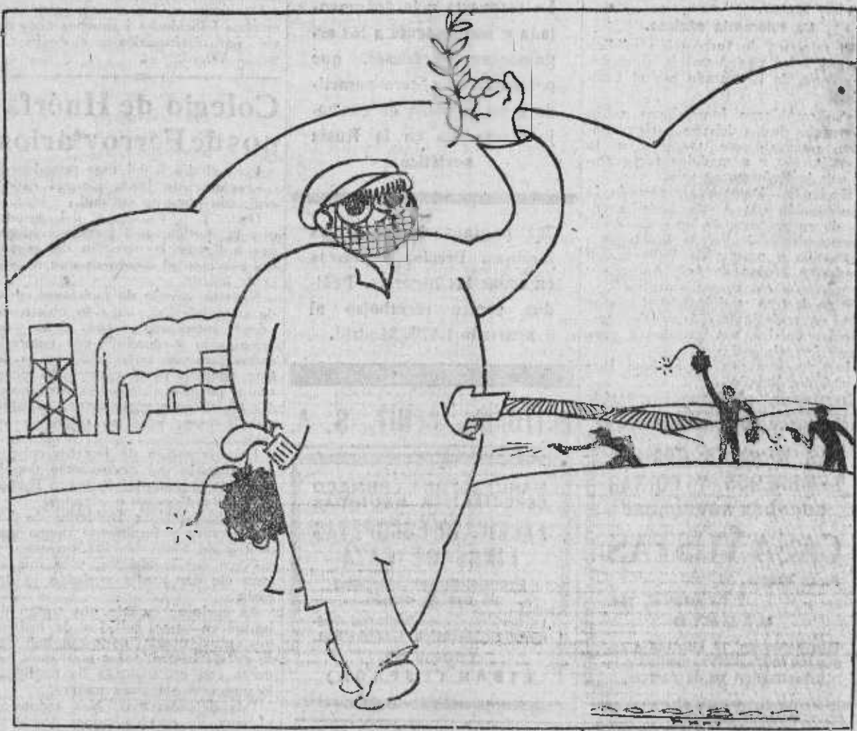
La Confederación es una organización revolucionaria, no una organización que cultive la algarada, el motín, que tenga el culto de la violencia por la violencia, de la revolución por la revolución. — (Del manifiesto sindicalista.)