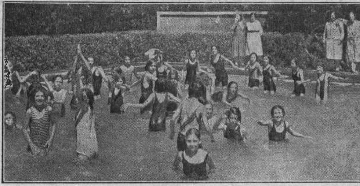
La hora del baño es una de las más deseadas por las niñas de la Colonia.