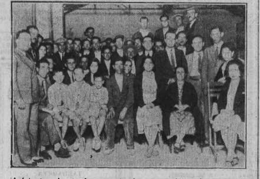
Asistentes al acto de propaganda cooperatista celebrado por la Cooperativa de Autos-Taxis.