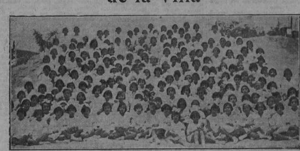
Después de incesantes trabajos se ha conseguido agrupar a las niñas de la Colonia.

En un pintoresco paraje de la Dehesa de la Villa, lindando con los pinares del Asilo de la Paloma, hace años viene funcionando la Escuela Bosque durante el curso escolar; el Ayuntamiento aprovechó durante los dos meses de verano, en que se suspende el curso, para mandar una expedición de niños de los Grupos escolares madrileños en colonia urbana.