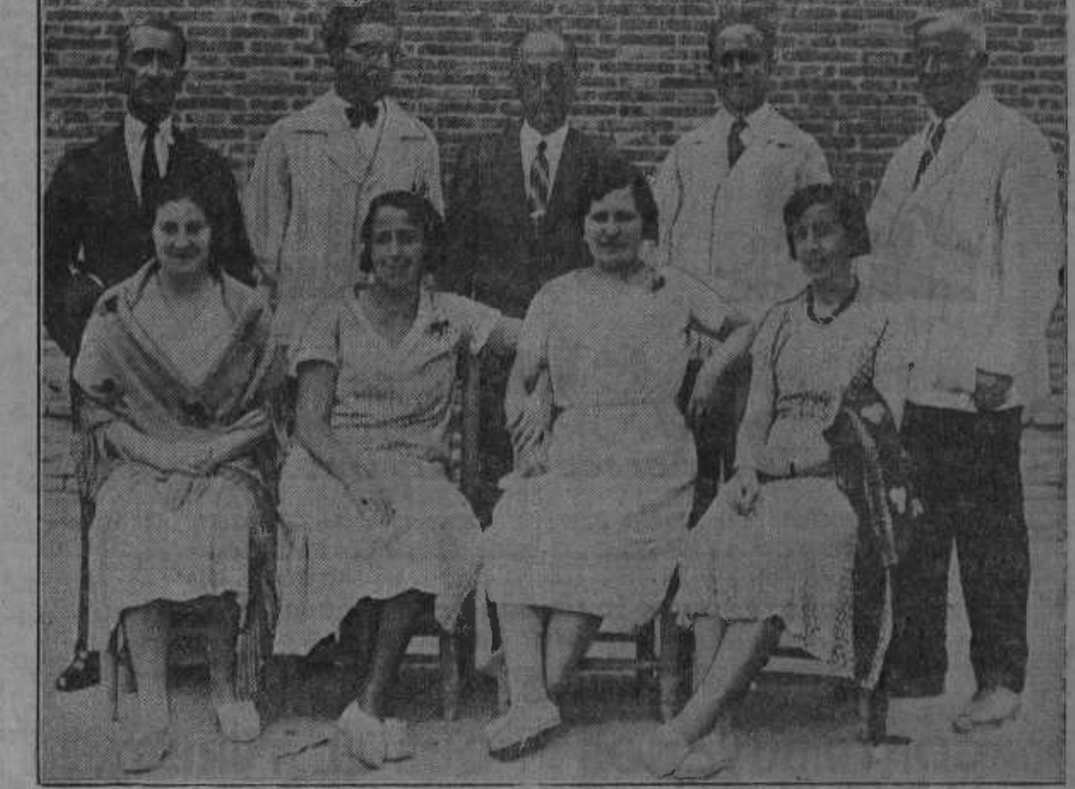
Cuadro de profesores de la Colonia urbana de la Dehesa de la Villa.

Martes.—Arroz con bonito en conserva. Carne de vaca en salsa de aceitunas. Postre: Pastelitos. Merienda: Plátanos. Miércoles.—Cocido, compuesto de sopa de pasta, garbanzos con repollo, carne de vaca, tocino, codillo y longaniza. Postre: Galletas de coco y Paris. Merienda: Queso manchego. Jueves.—Sopa de pan y huevos. Bonito con tomate. Postre: Merme-lada. Merienda: Bocado de jamón. Viernes.—Judías blancas estofadas. Cordero asado, con ensalada. Postre: