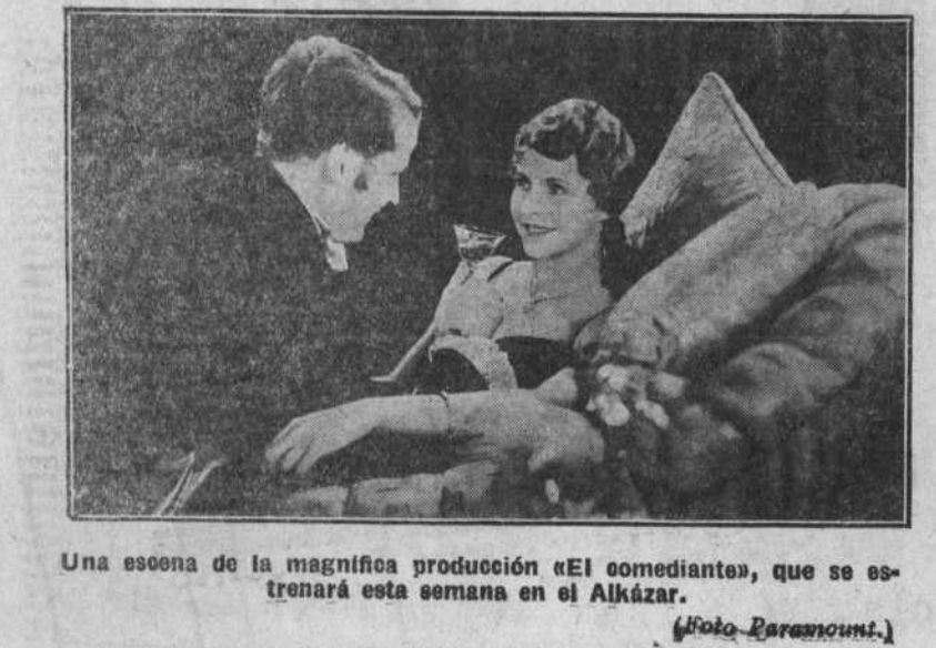
Una escena de la magnífica producción «El comediante», que se estrenará esta semana en el Alkazar.