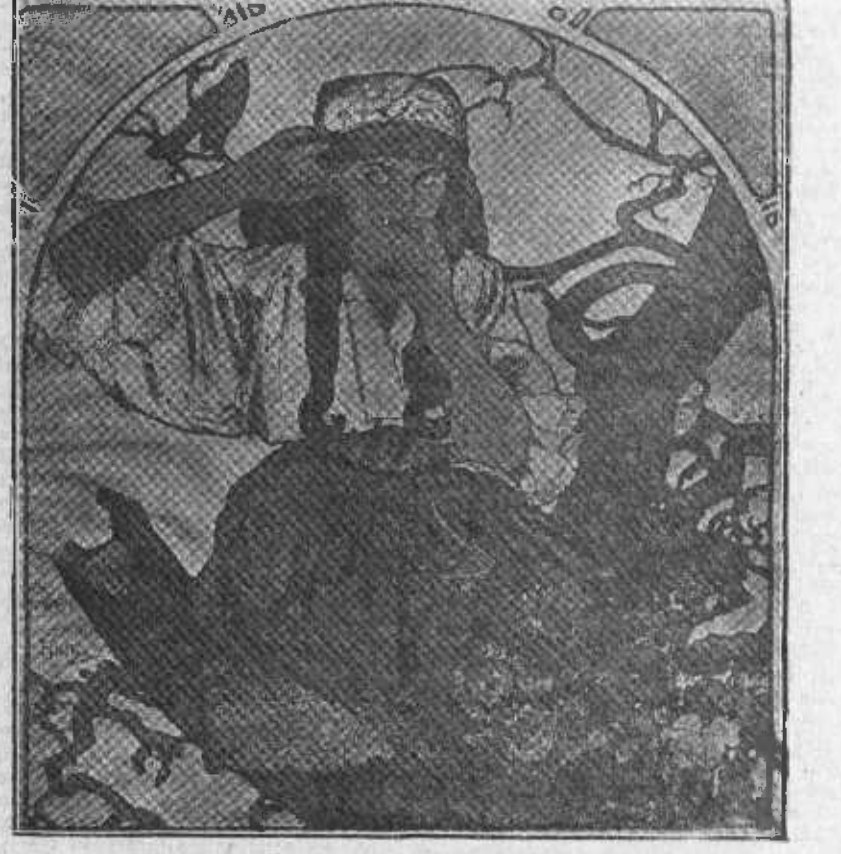
Cartel anunciador de la Asociación de Maestros de Moravia, obra del pintor checo Alfonso Mucha.

Aunque aquí sabemos poco de esa Asociación y de su director, sin embargo, tanto aquella como éste gozan de solidísimo prestigio en toda la Europa central y en otros países enclavados fuera de esa vastísima área geográfica. Ese prestigio se difundirá bien pronto por nuestra península, pues