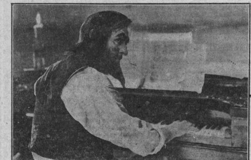
John Barrymore, maravilloso intérprete de «Svengali».

Agradecemos el envío de este interesante boletín.