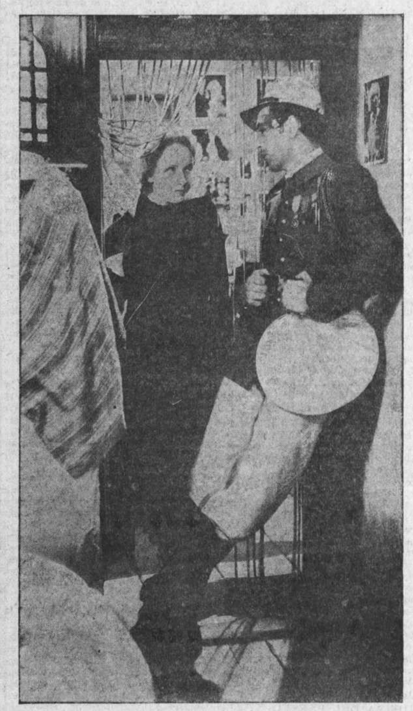
Mariane Dietrich y Gary Cooper en una escena de «Marruecos», bello film que próximamente veremos.