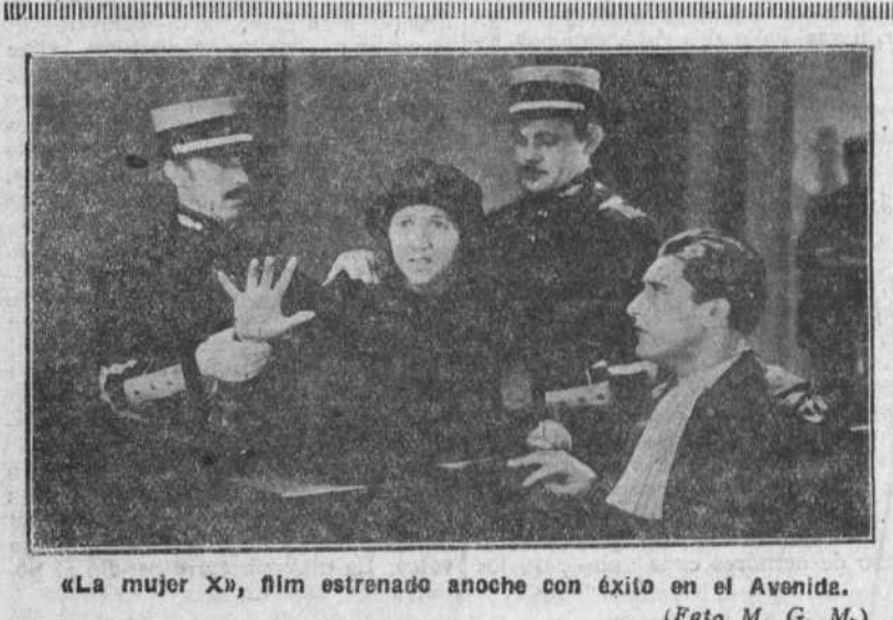
«La mujer X», film estrenado anoche con éxito en el Avenida.