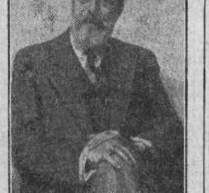
«El maestro Fernández Arbón», retrato al óleo por Maroussia Valero, que figura expuesto en el Círculo de Bellas Artes.

Leandro Oroz expone otros dos retratos. Raquel Meller, que ha inspirado a multitud de artistas, ha ins-