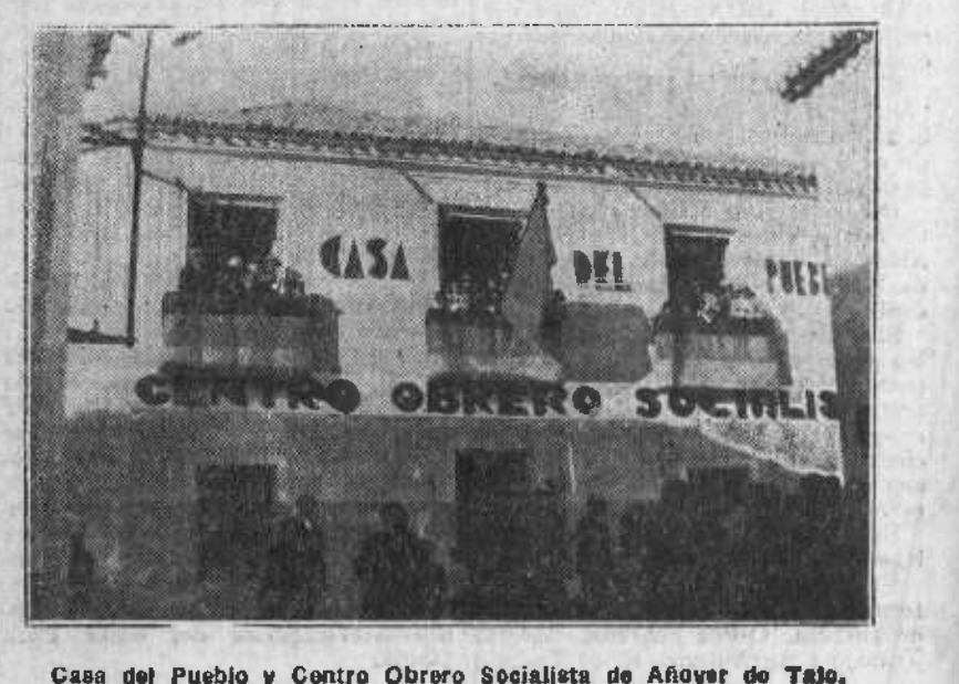
Casa del Pueblo y Centro Obrero Socialista de Ahoayar de Tajo.