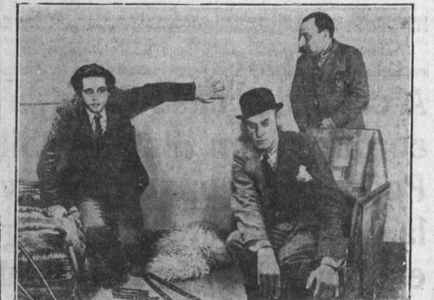
«El tren de los suicidas». Una escena muy expresiva de este bello film.