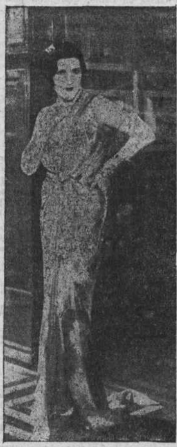
Jane Marnac, «vedette» de «Paris-Beguín».