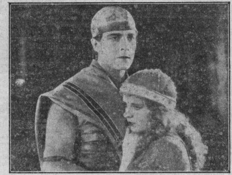
«Ben-Hur», que retorna triunfalmente al cine... sonoro esta vez.

flote el casco del «Lusitania», quiere filmar los trabajos que a tal fin realiza.