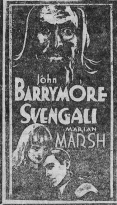
John Barrymore en «Svengali», que se estrena mañana en el Cine Callao.

prohibida la exhibición del film «Batallas en Manchuria».