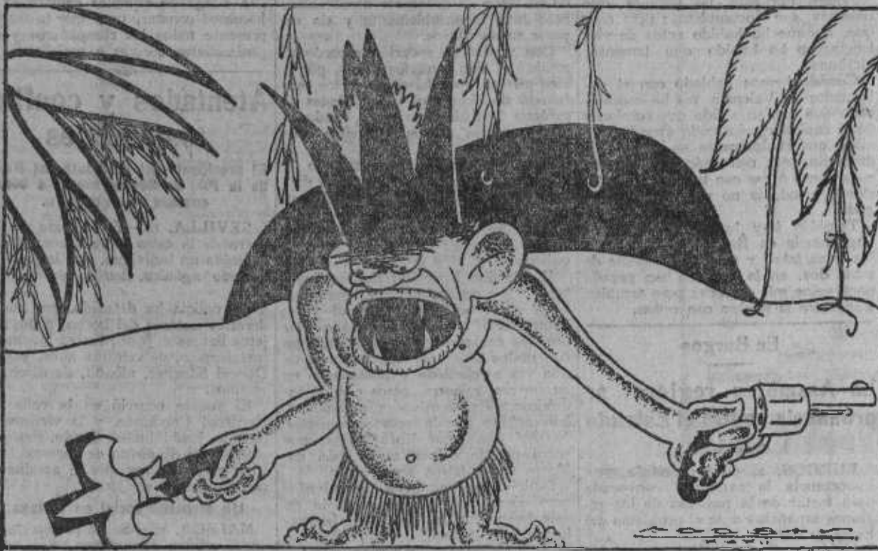
...Y muera quien no piense igual que pienso yo.