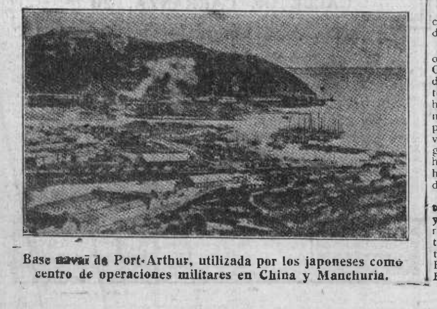
Base naval de Port-Arthur, utilizada por los japoneses como centro de operaciones militares en China y Manchuria.