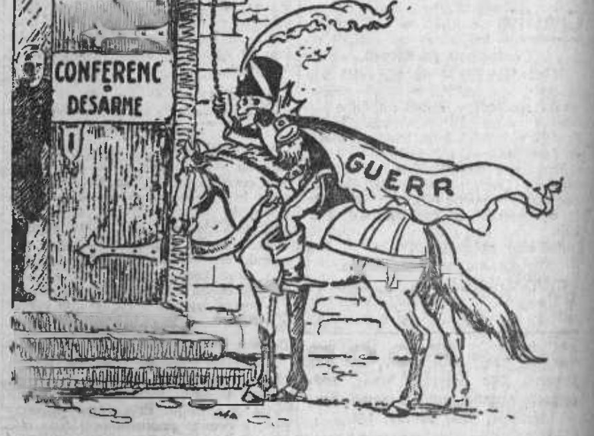
La Guerra viene a solicitar su licencia absoluta de la Conferencia del Desarme