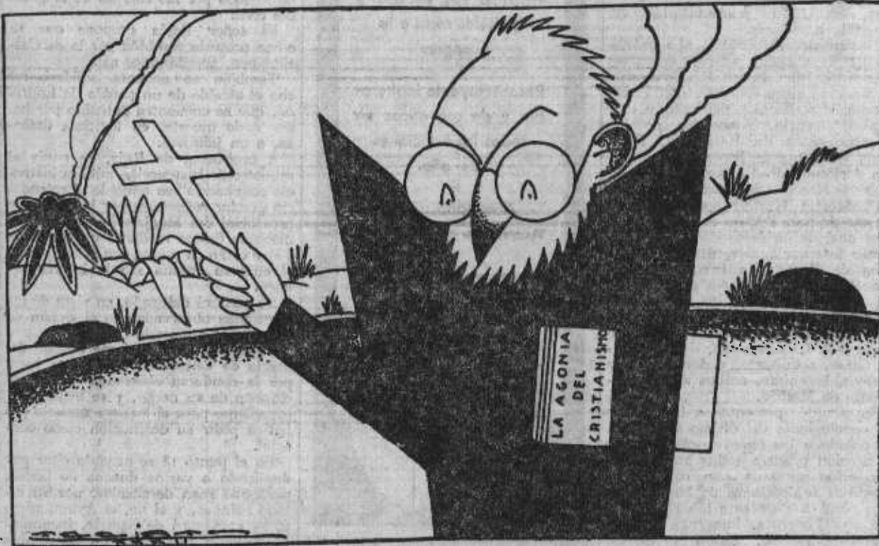
El reverendo padre fray Miguel de Unamuno en una nueva modalidad de sus múltiples facetas intelectuales.