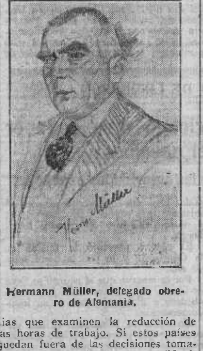
Hermann Müller, delegado obrero de Alemania.