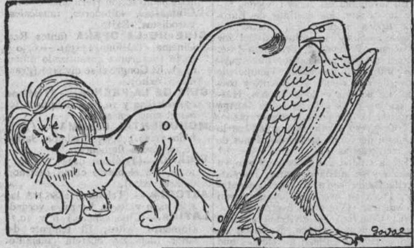
Ha sido un desierto despertar al león de Baviera. (De Uhr Abendblatt, de Berlín.)