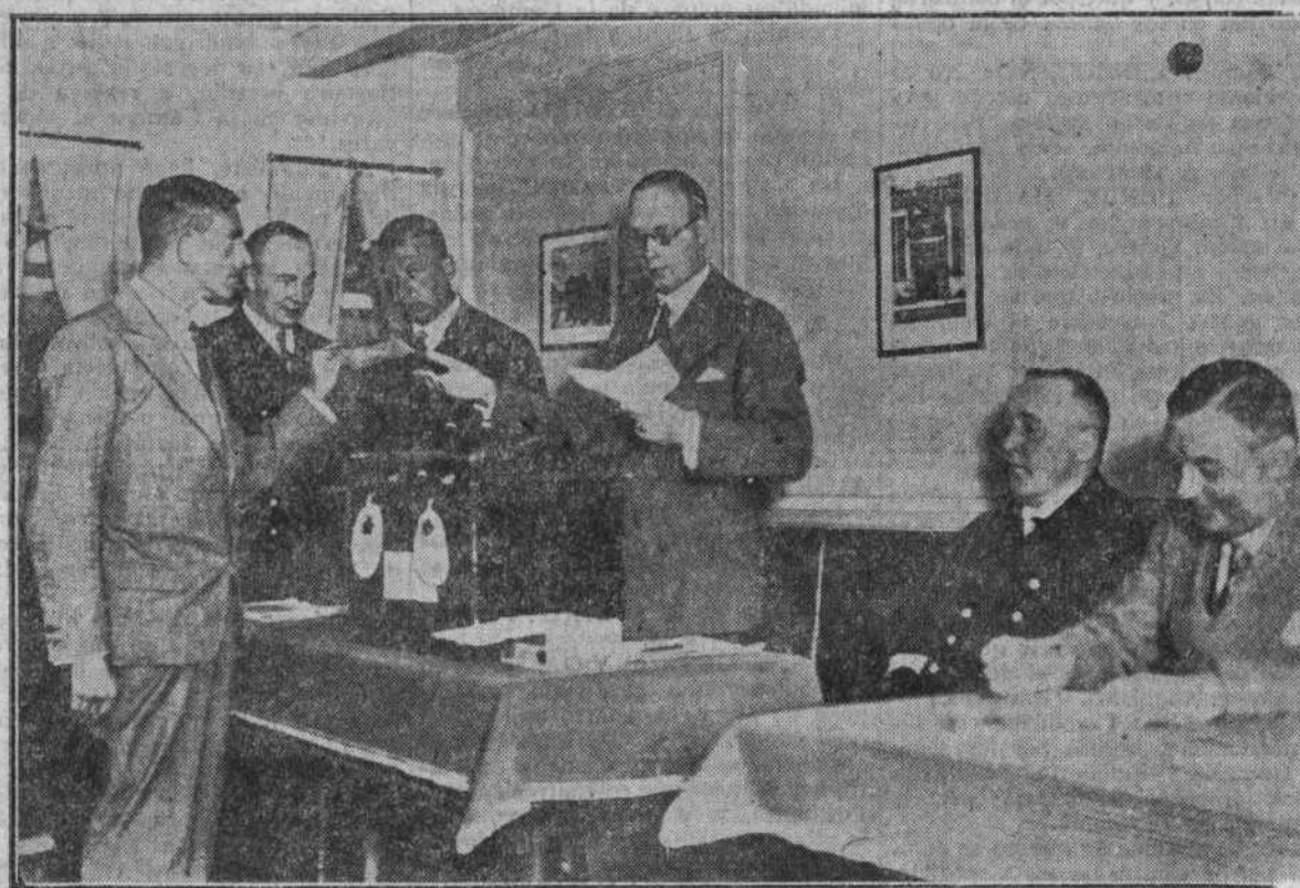
Emitiendo el sufragio a bordo de un buque alemán.

El pleito en el tapete, conviene dejarlo totalmente fallado. Esperemos que la interpelación reanudada ayer tenga esa eficacia saludable.