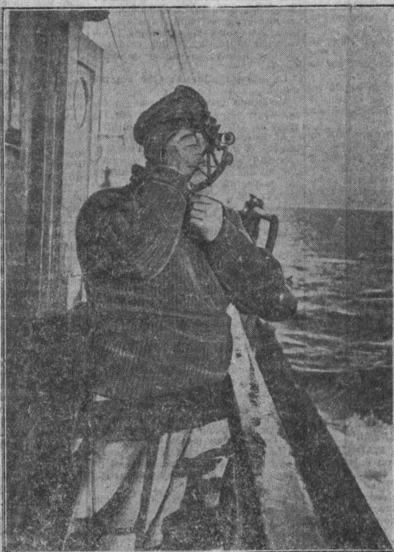
El capitán de un buque averiguando la altura con ayuda del sextante.

Es, pues, un razonamiento que no justifica la inhibición. Con la pupila en el sextante, rectificando rumbos, todo marino ha sorteado demasadas dificultades para que acepte las que puedan oponerse a que, sin interrumpir su trabajo, haga pesar su voluntad en los plebiscitos nacionales.