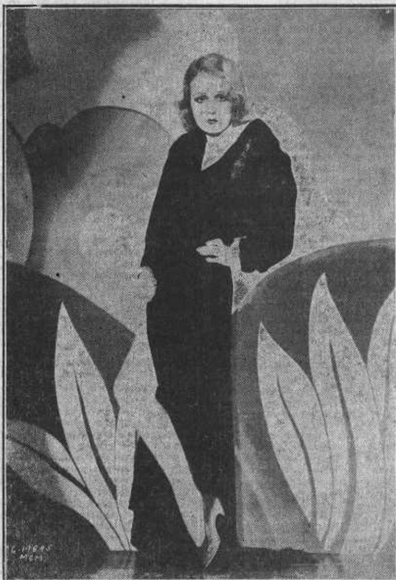
Anita Page, la preciosa estrella, que brilla una vez más en «El destino de un caballero».