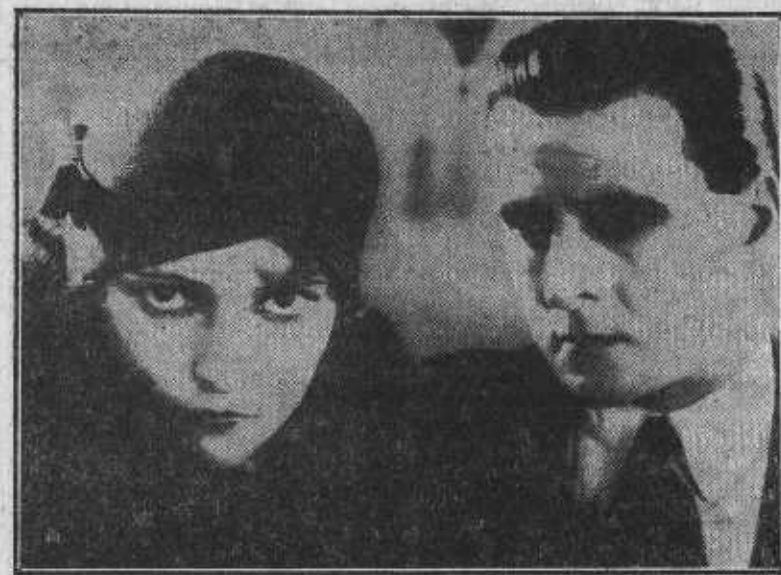
La película «Eroticón», una de cuyas escenas reproduce el grabado, es esperada con gran curiosidad.