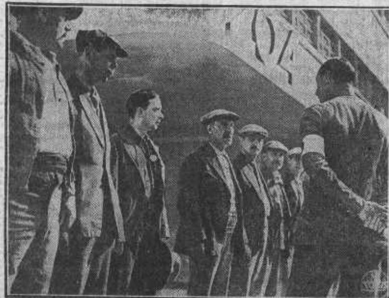
Una escena de «Viva la Libertad», la última superproducción de René Clair.