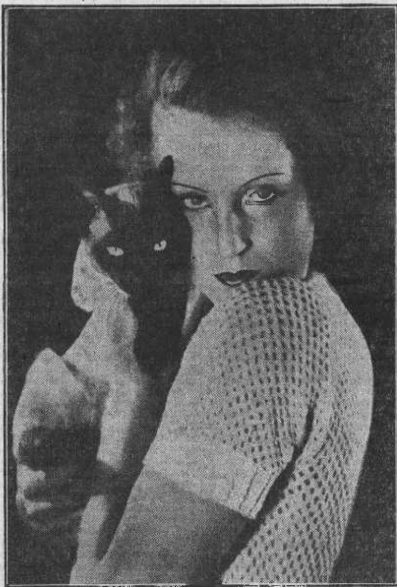
En el film «Órdenes secretos» es «vedette» esta lindísima Brigitte Helm, que aparece con su gato-mascota.

Y ahora se nos ocurre preguntar a quien corresponda: ¿Cuándo podremos ver en una sesión de Proa la «Línea general»? ¿Cuál ha sido el destino dado a «El acorazado Ponomkin»?