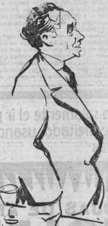
PAUL FAURE, diputado socialista, cuyo reciente discurso sobre los traficantes en armamentos ha producido tanta sensación en Francia, que el Partido ha acordado hacer una gran tibia y repartida profusamente.

Una nota sobre las conferencias políticas. — Un cablegrama argentino. Visita de diputados. La Jefatura de Prensa de la Presidencia de la República dió la nota siguiente: «La Secretaría general de la Presidencia de la República ha corroborado la absoluta negativa acerca de las conferencias políticas mantenidas por el señor presidente, repitiendo que no ha habido ninguna. Añade una vez más que la casa y la vida particular del señor Alcalá Zamora son totalmente extrañas a la acción oficial, que se desenvuelve tan sólo en la Presidencia pública y normalmente. El señor Alcalá Zamora ha recibido un cablegrama del nuevo presidente de la República Argentina, general Justo, agradeciendo la felicitación enviada por el presidente de la República Española con motivo de la toma de posesión de aquella alta magistratura. El general Justo hace votos por la prosperidad de España. El presidente de la República recibió a veinte diputados.»