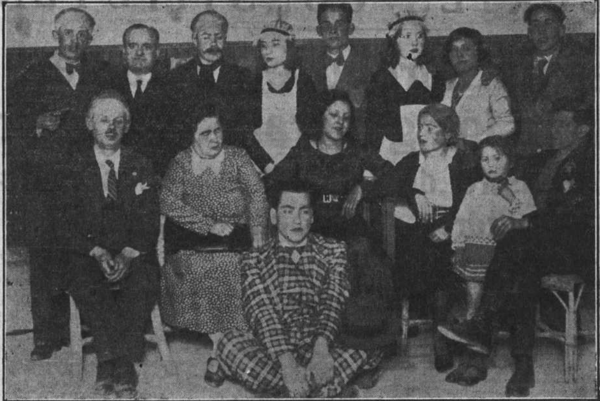
Camaradas que tomaron parte en el festival celebrado en el Círculo Socialista del Norte

PI y Margall, 18. Apartado 540. MADRID Obras a reembolso. Se admiten responsabilidades.