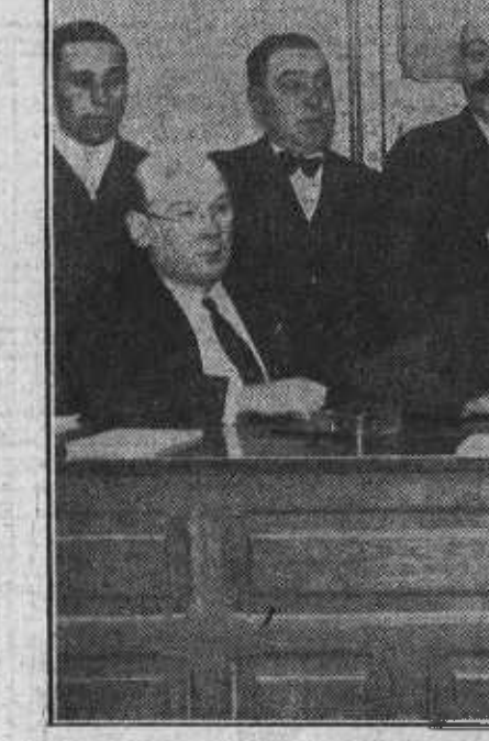
Mesa presidencial del Congreso de Litógrafos celebrado días pasados en Madrid

En los trabajos de extinción intervinieron las autoridades, asistidas del vecindario.