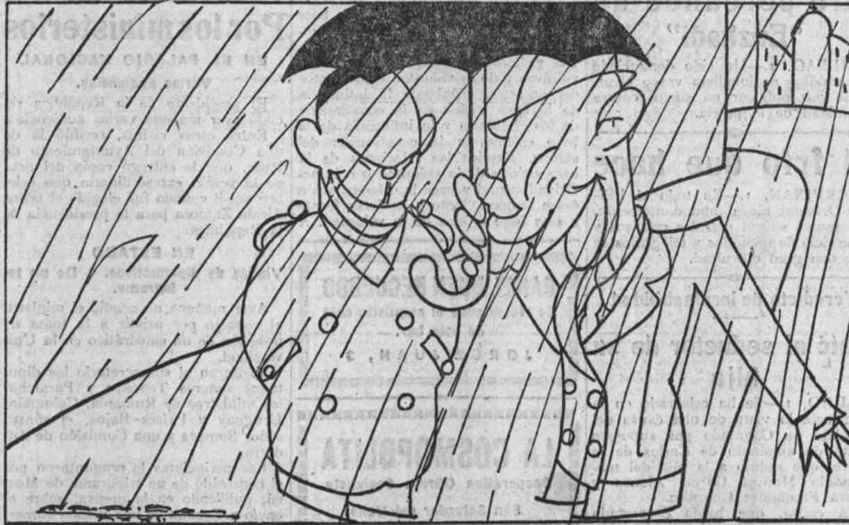
—Hace falta saber ahora si después que gobierne Lerroux quedará España para cantarle el «Gloria!» de Clavé.

... en aquel «Gloria a España!» que Clavé hacía cantar por medio de las voces populares de vuestros coros, que tan honda emoción causan en mi alma. (Del discurso de Lerroux en Barcelona.)