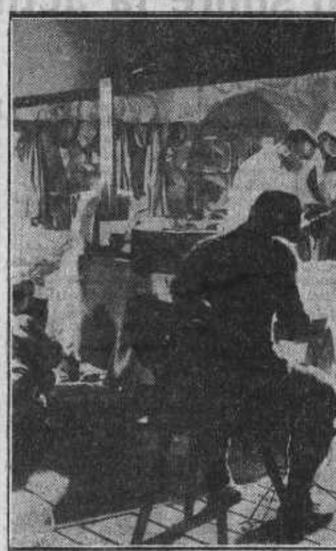
Escena de «Montaña en llamas», film que se estrena mañana en Callao. — El monstruo, del «Doctor Frankenstein», la película terrorífica que el lunes presenta Palacio de la Música.

La censura suele rendir algunas veces pletóricas al reinado de la imagen, puesto que, a veces, obséquiala con sus rigores. Parece como si supiera que lo que en la escena se declara no tiene alcance, carece de eco; que lo que se proyecta en el luminoso rectángulo permanecerá, por el contrario, en los ojos y en los cerebros y determinará los pensamientos y las acciones de la multitud. Indulgente con las estériles pantomimas, estable-