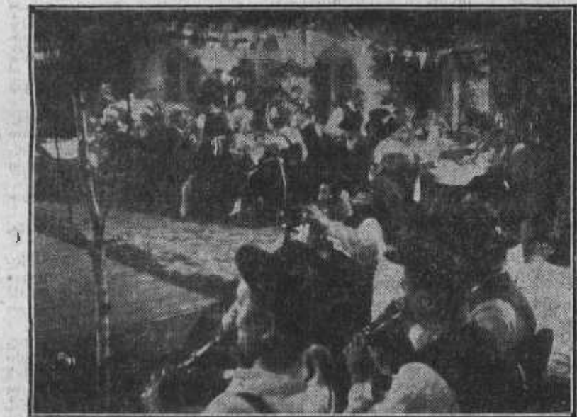
Fiesta de bodas, en «Catalicismo», la magnífica película que exhibe Rialto.

«En el año 1931 proyectó Gaumont una serie de «films» culturales de la U. F. A., cuyo éxito superó a las grandes esperanzas que se habían puesto en ellos. En consecuencia, la casa Gaumont ha adquirido un gran número de nuevos «documentales» de la U. F. A. para sus programas de 1932.