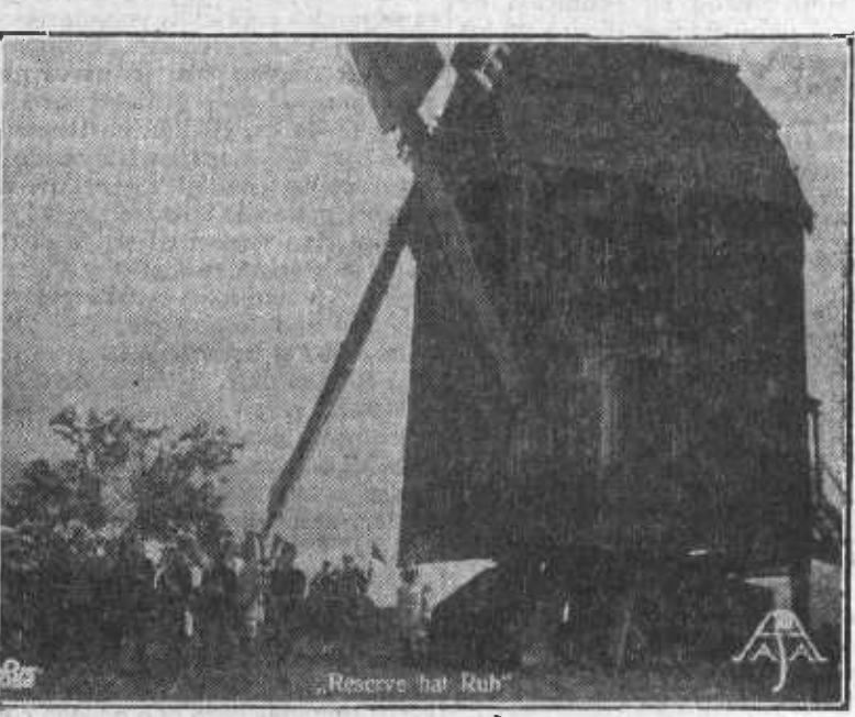
Una escena de «Milicia de paz», el éxito de risa del Alkazar.