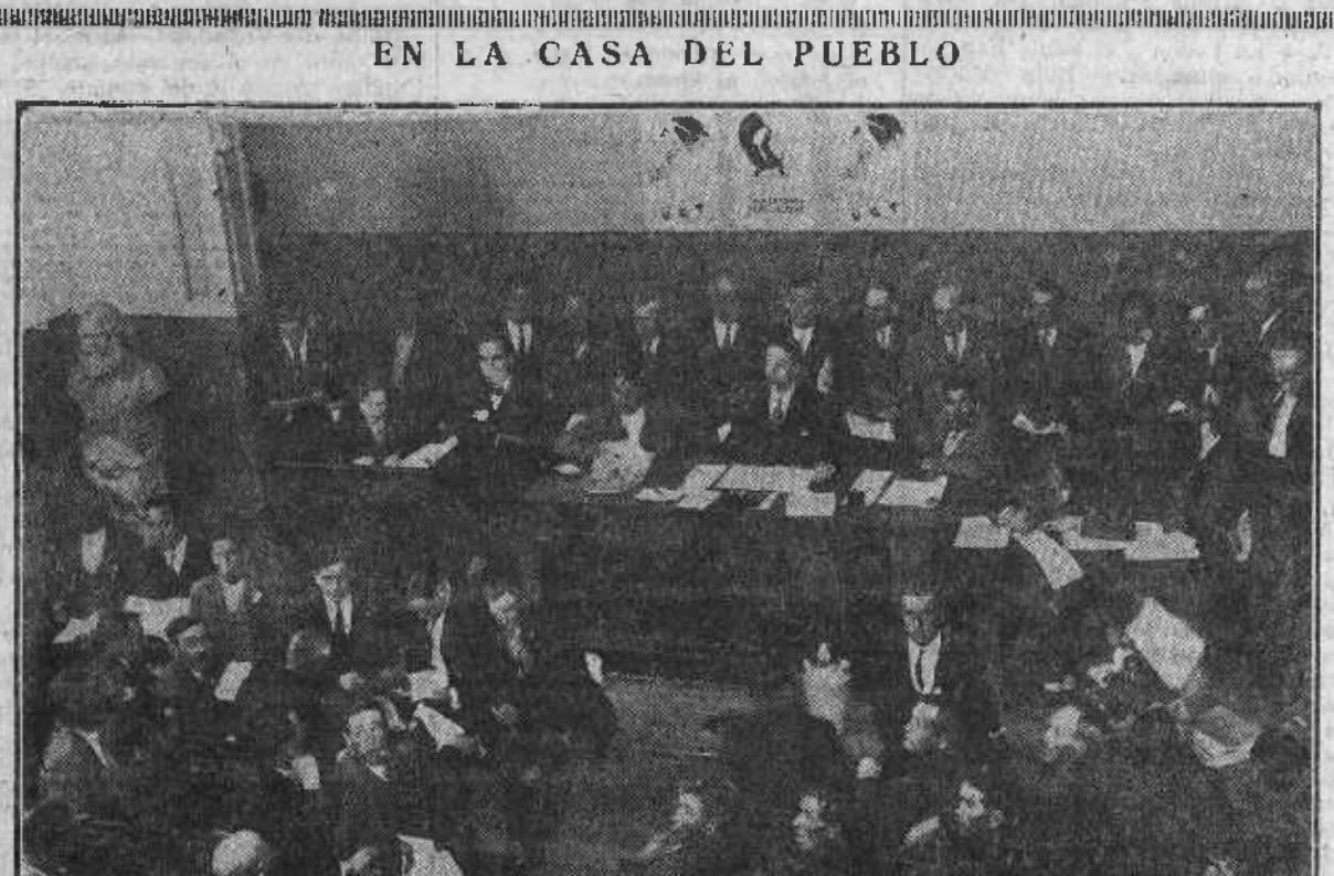
La presidencia con algunos de los delegados que han asistido al Congreso regional de Trabajadores de la Tierra