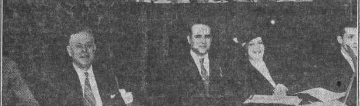
Mesa presidencial en el acto de inauguración celebrado el domingo