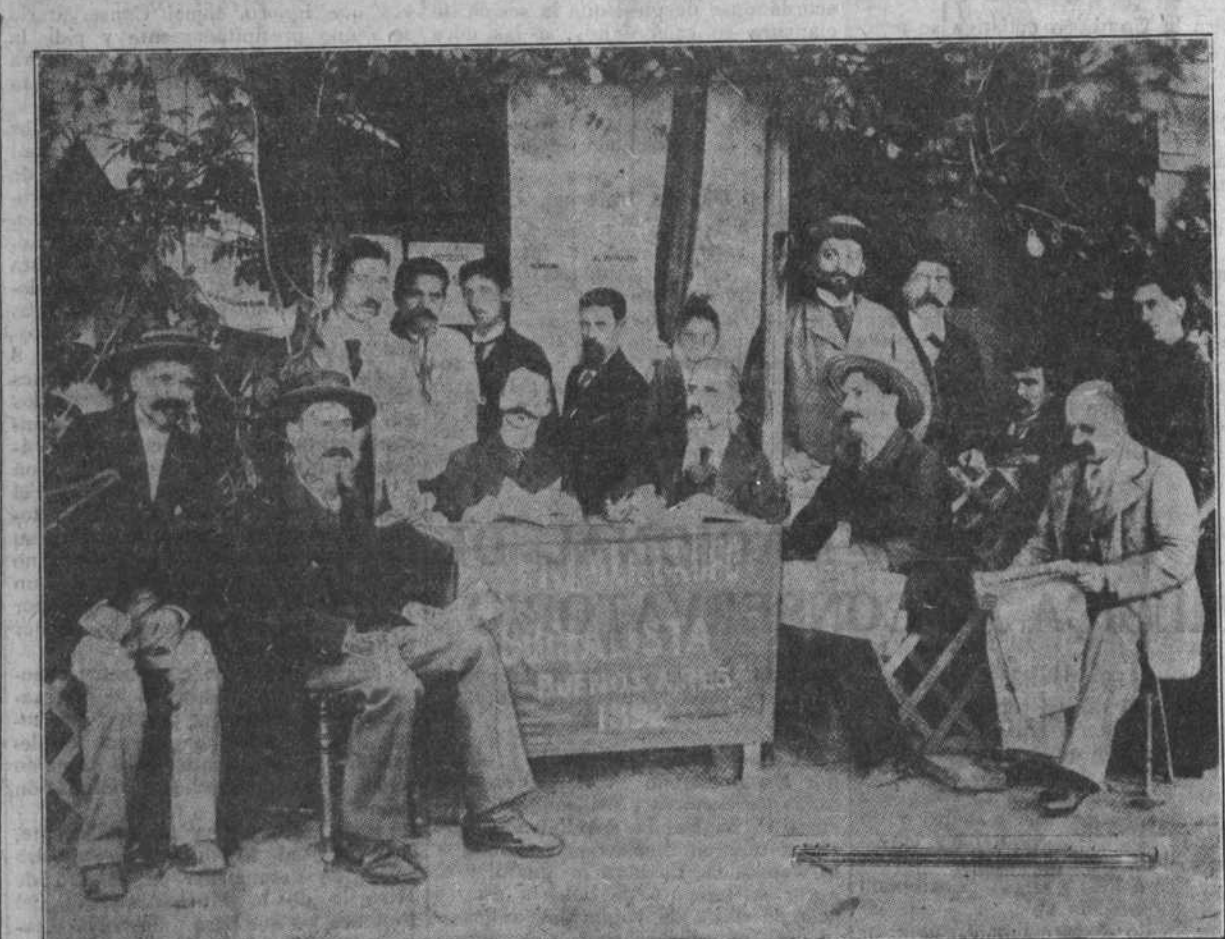
Son los precursores. Hombres de otro tiempo. De hace cuarenta años. ¡Cuántas cosas han ocurrido en los últimos cuarenta años! He ahí al primer grupo socialista de Buenos Aires. Eran los días en que América se hallaba completamente virgen de Socialismo. Buenos Aires contaba ya con su pequeña célula socialista. Total, doce hombres. Detalle interesante, dos mujeres. Así se inició la organización socialista platense. Catorce personas. Catorce luchadores. ¿No se morirían de ellos los neutros? Tan pocos y un programa tan ambicioso: la conquista del Poder político, la socialización de los medios de producción y cambio. Y para todo eso—¡casi nada!—doce hombres y dos mujeres en Buenos Aires, en toda América, puede decirse. Casi todos esos luchadores, que desafiaron a fines de siglo a la sociedad burguesa, son españoles. Casi todos. Nace, pues, el Socialismo en la Argentina con nervio de España. Era nuestra reconquista de América. Y hoy, que se trata de conmemorar en Buenos Aires aquel gesto de nuestros compatriotas, deseamos desear aquí un recuerdo emocionado a doce hombres y a dos mujeres.

—Lógicamente, yo no lo percibo. Cada uno expondrá sus puntos de vista; pero eso es difícil de prever. Nuestra actitud es clara para ahora y para el porvenir. Lo que hace falta es que los demás hagan igual. Lo que no puede hacerse es tomar a broma la República, pues eso no lo consentimos nosotros, después de los trabajos que ha costado traerla.