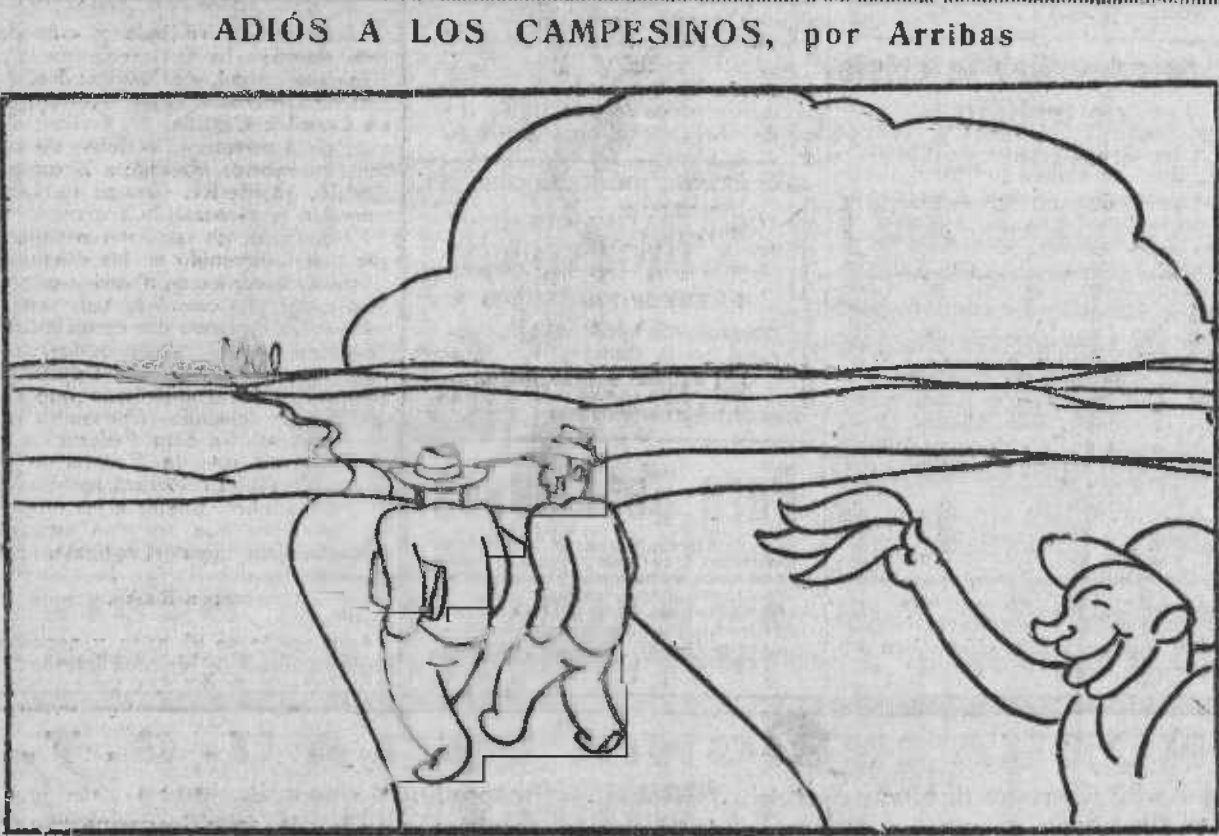
¡Adiós, compañeros! Vuestra es la verdadera revolución.

EL SOCIALISTA.—Teléfono de la Redacción: 41378