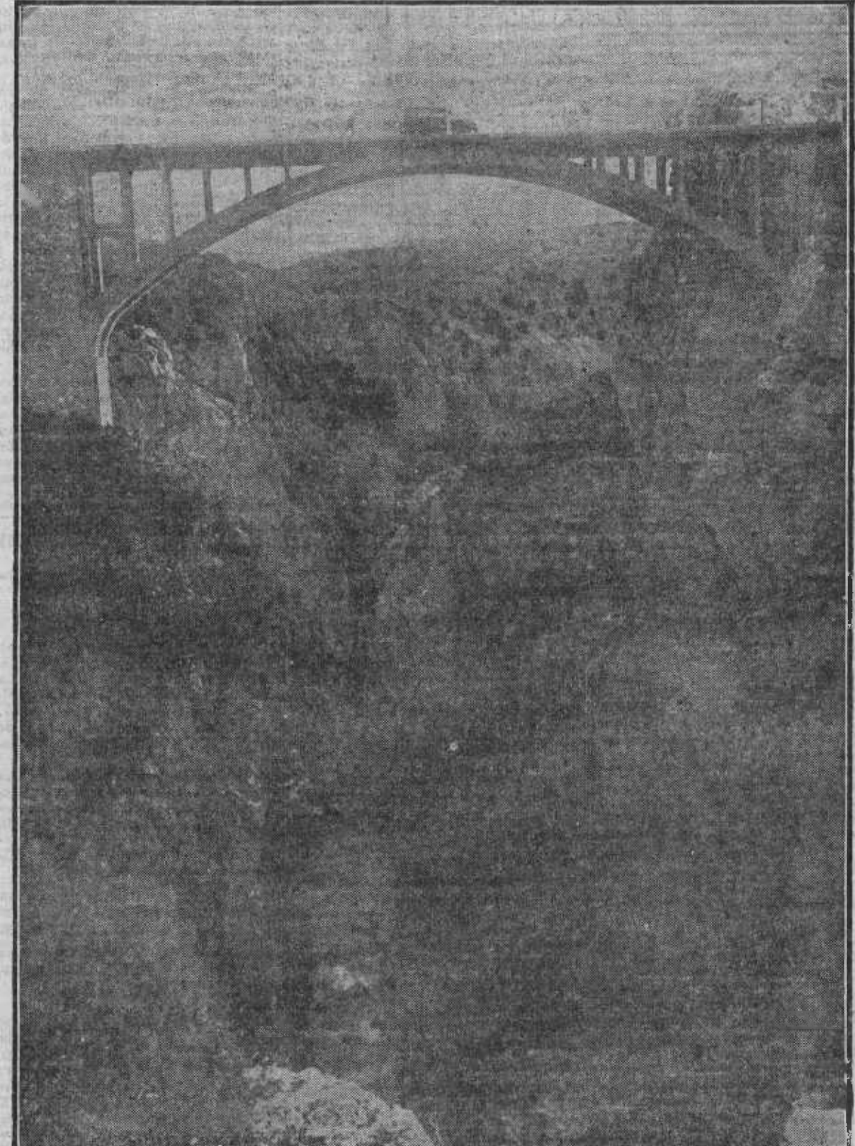
Puente de Huéscar a Castril, de 93 metros de altura, por donde se despeñó la camioneta que conducía a 24 camaradas nuestros que regresaban de asistir a un mitin socialista y que encontraron la muerte en el fondo del barranco.