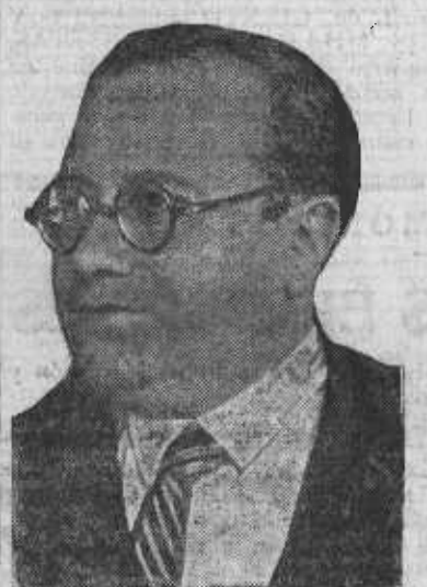
Luis Jiménez Asúa.

El ex anarquista «Azorín» y demás defensores más o menos vergonzantes del multimillonario fugitivo van a tener que explicarle por qué una revista de prestigio del «New Statesman» se permite contar tales verdades al público inglés, en vez de acoger un «extenso» y con toda suerte de comentarios favorables las propias declaraciones del «March-am», según hizo la prensa reaccionaria francesa. Acaso le digan que ese tipo de periodista inglés fuma tabaco de otra clase, y no admite propinas.