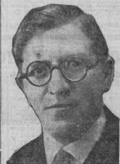
Julio Alvarez del Vayo.

Más que aliento, más que la hinchada prosa que pudiera destinarse a enardecer a nuestros camaradas y a contagiar de entusiasmo a los que nos dedican su simpatía, nosotros sentimos la necesidad de hacer tan sólo una afirmación: la de que cumpliremos nuestro deber. Nuestro deber nos ofrece cada día nuevas dificultades y se torna espinoso y áspero cuando, como ahora, se bordean las situaciones más duras y cuando, como ahora, la tensión en la que ha entrado España amenaza con empujarnos a actividades de otra naturaleza. Quienes hoy votan la candidatura socialista nos piden algo más que seguir adelante. Ya no es el voto ilusionado, vago, con la imprecisión que da la lejanía de las aspiraciones que hasta hace un poco tiempo tenían el contorno nebuloso de los sueños. Hoy se va a votar concretamente, rabiosamente, si cabe la frase, por realidades inmediatas, y esta misma postura al emitir el sufragio la tienen todos los electores. No será mucho que nosotros la tengamos también. Durante muchos años hemos votado para hacer crecer nuestra esperanza. Hoy votamos para amasar realidades