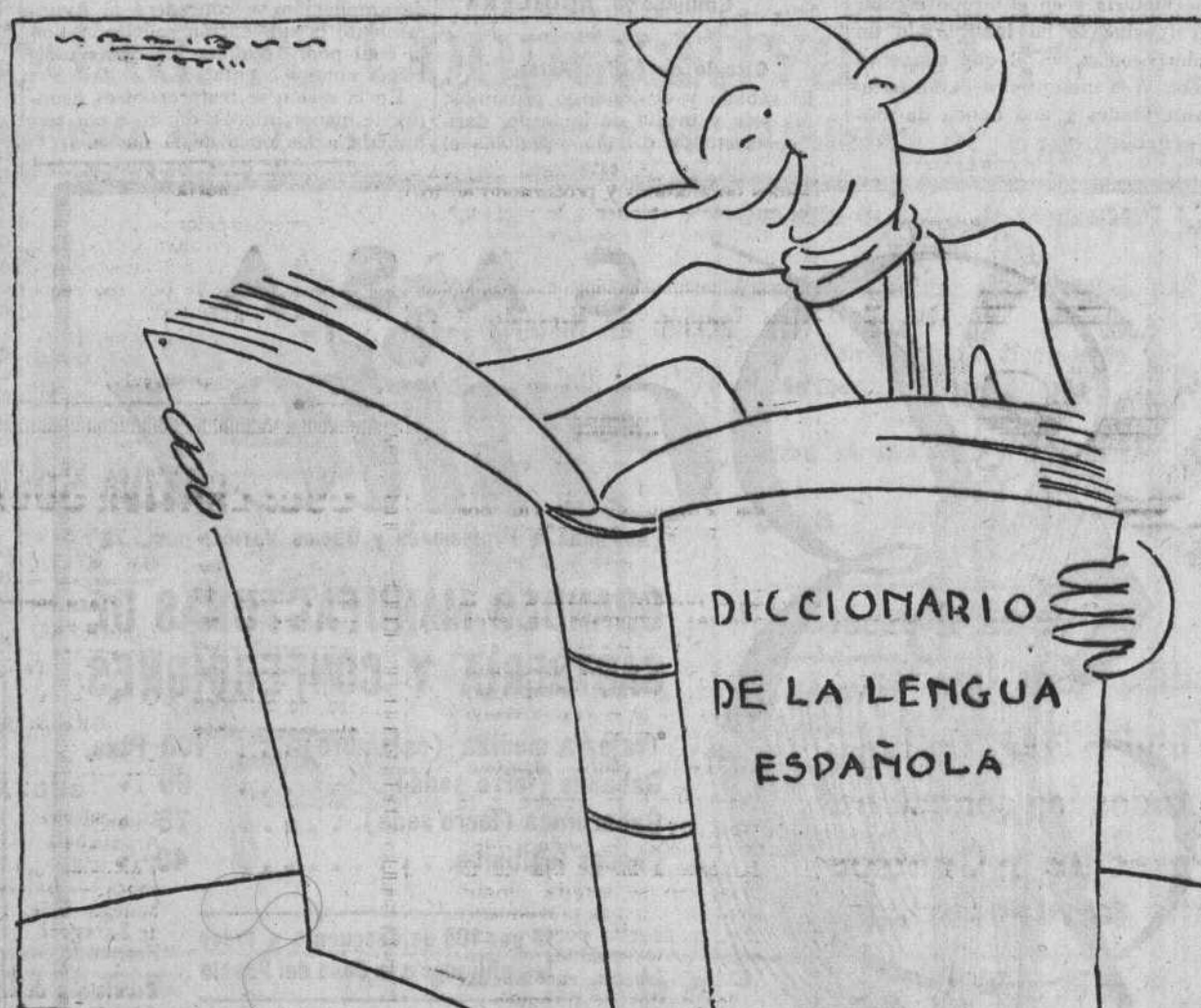
—«Revolta.—Segunda vuelta o repetición de la vuelta.» ¡Bravo, bravo! Vamos a la segunda vuelta.

ra discusión, se aceptó la enmienda del representante de los trabajadores de la tierra.