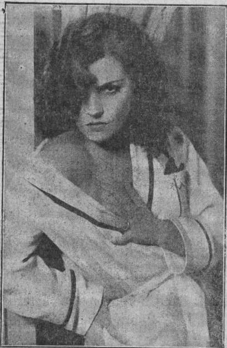
La preciosa Lily Damita, nueva conquista del Tío Sam, protagonista del film "Amigos o rivales", la gran película que mañana se estrena.