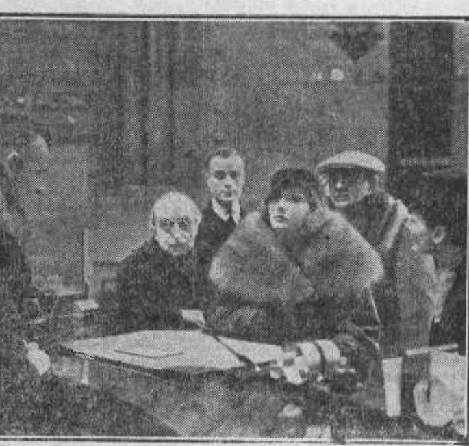
Una escena de "Grand Hotel", acontecimiento cinematográfico de ayer, con la interesante figura de Greta Garbo.

Wolfgang Klein.—Llevar la contraria a todo el mundo. Para mí nada tiene razón. Es un defecto lamentable que he tratado de curar mil veces; pero no me es posible. Ya se pueden decir verdades como temple a mi lado... No creo a nada, nadie tiene razón, sólo yo, que no sé lo que digo. Los amigos ya deben haberse dado cuenta, porque no me hacen caso. Durante una filmación tuve con uno de ellos el disgusto más grande que usted puede imaginarse. Todo por llevarle la contraria.