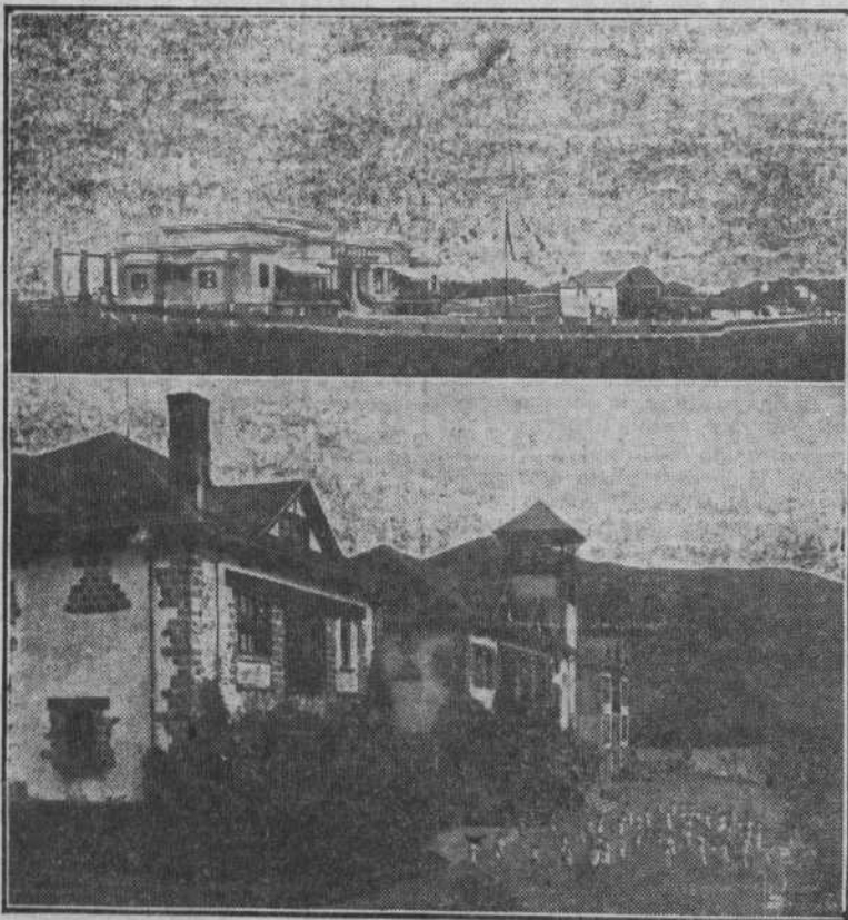
Arriba: La Casa del Niño, en Bermeo. Abajo: Aspecto parcial de la Colonia escolar permanente de Pedernales.