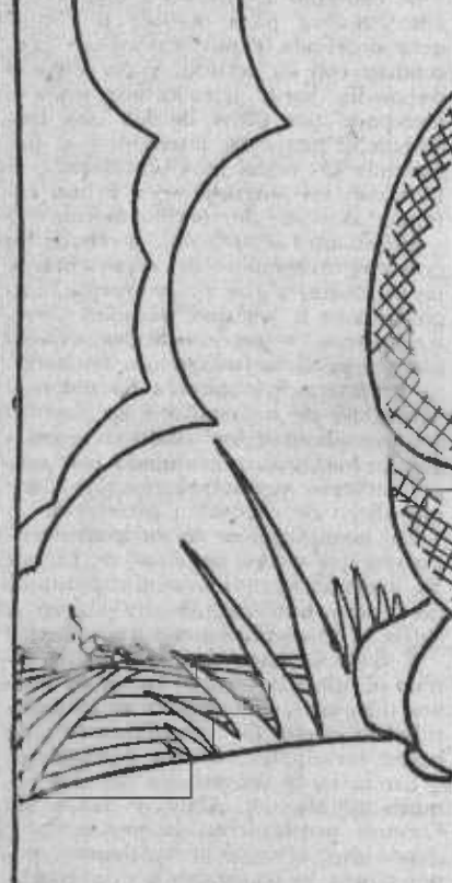
¡Oh qué sueño! Se me hace la boca agua pensando lo que serían nuestras "pacíficas manifestaciones" con fusiles, ametralladoras, camiones, y a las cuatro de la mañana...