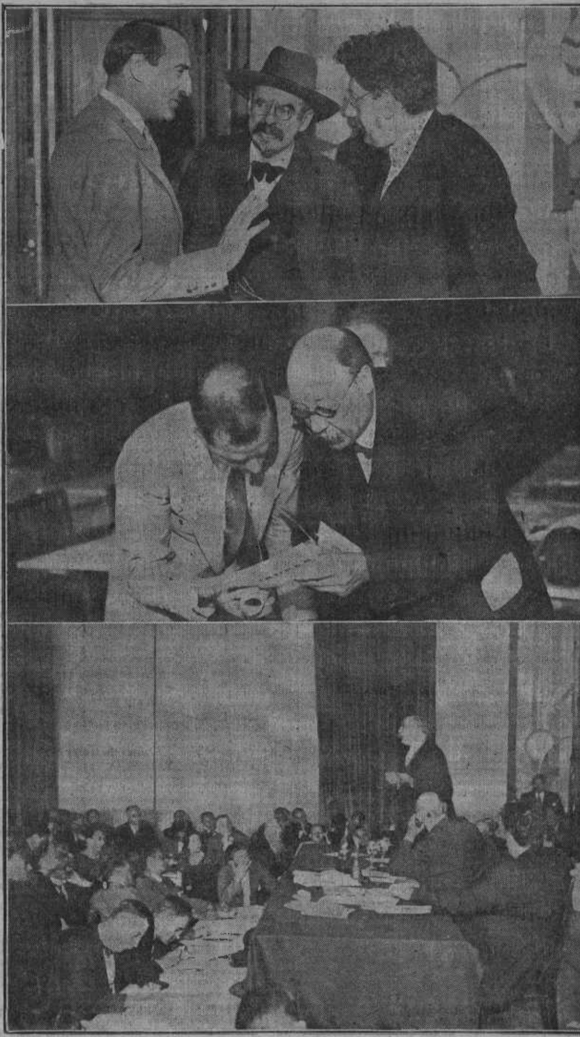
Arriba: Los camaradas Marquet, alcalde de Burdeos; Vanderveelde y Federico Adler conversando en un descanso de la Conferencia. En el centro: Kriger, delegado americano, y Renaudel examinando el texto de la declaración publicada por la mayoría de los diputados socialistas franceses. Abajo: Blum pronunciando su discurso ante la Conferencia.