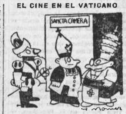
—¿Es verdad que no parezco demasiado vampiro? (Dibujo de H. Monnier, en «Le Canard Enchaîné»)

Una huelga de técnicos de cinematógrafo CALIFORNIA, 23.—Lejos de resolverse, cada día que transurre va agravándose más la huelga de técnicos del cinematógrafo.