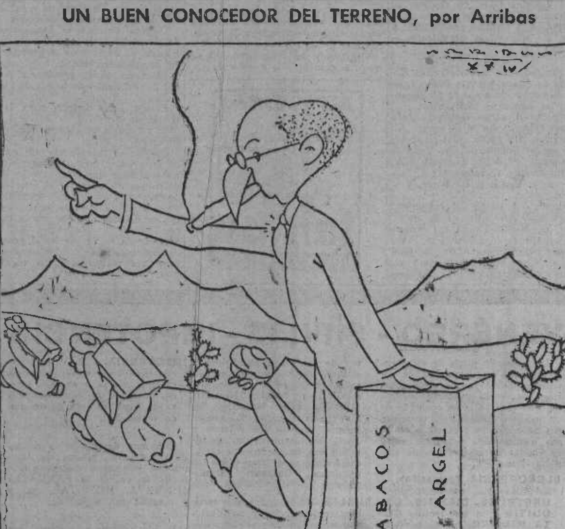
Don Juan March, a quien proponemos para alto comisario en Marruecos. Cuenta con ejército "adicto" y flota propia