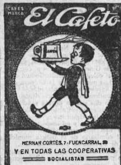
HERNAN CORTES. 7. FUENCARRAL. Y EN TODAS LAS COOPERATIVAS SOCIALISTAS