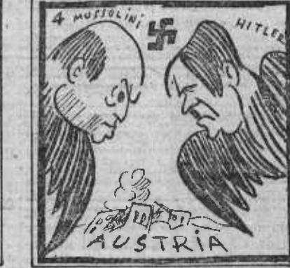
¡Pobres, cuenta no se dan que se hallan sobre un volcán!