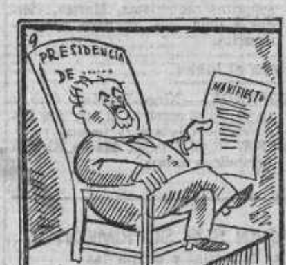
Pide el nuncio con amor, y le atienden, ¡sí, señor!