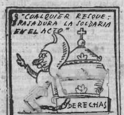
Ya va pensando la gente que sólo hay un presidente.