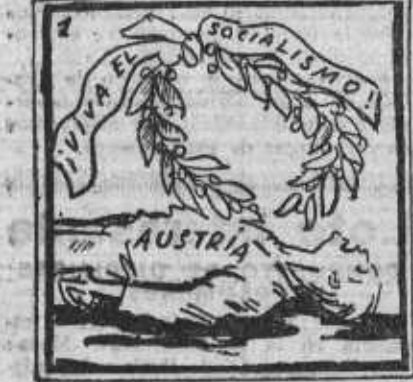
¿Quién, con esto ante la vista, no ama la causa marxista? [ta,