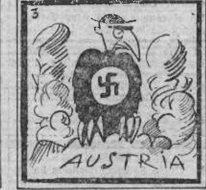
Y ved a los dos rivales, que acechan como chacales.