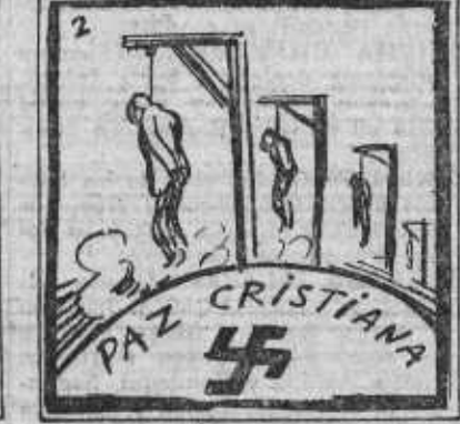
Ved al ruin demoleedor, al jesuitismo traidor.