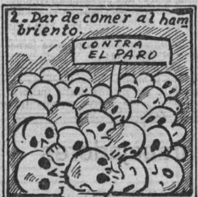
Gran remedio contra el paro; ya veis: no resulta caro.