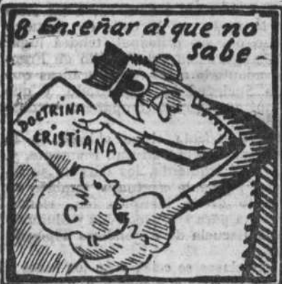
Con santo amor y cariño cellos educan al niño.