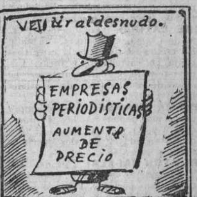
Aumentarlo, ¡pobrecitos! Qué pena: están desnuditos!