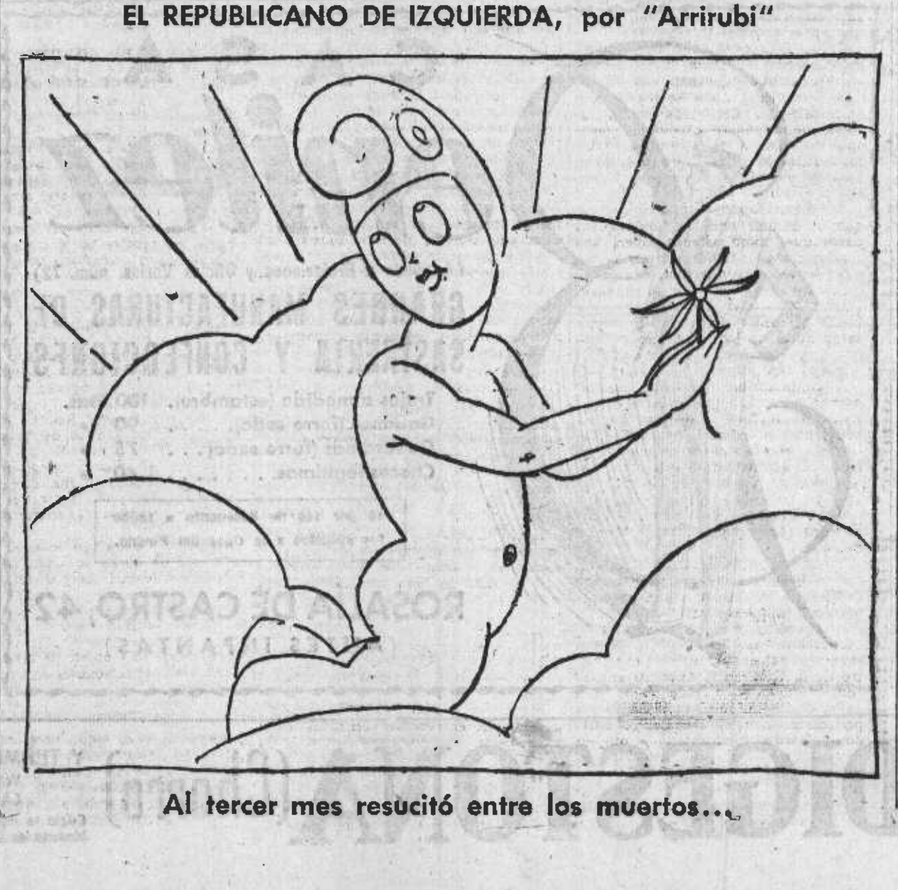
Al tercer mes resucitó entre los muertos...

Un caso concreto el de la Prisión provincial de Alicante. El cupo normal de esta prisión es de unos 150 reclusos, con una asistencia corriente para el día de mañana de unos 200 reclusos.