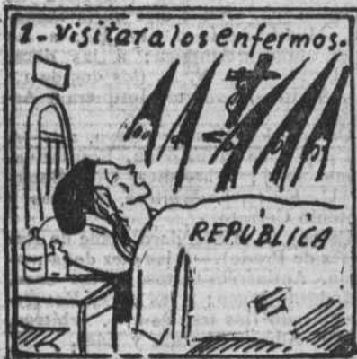
La pobre está muy malita. Sólo toma agua bendita.

(Influído por la semana pasada, que ha sido completamente santa)