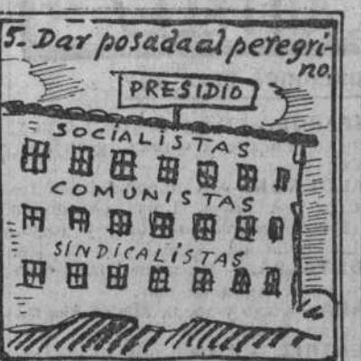
Cumplidamente y con tino dan posada al peregrino.