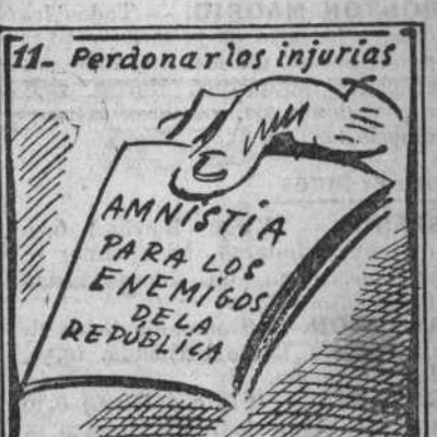
No sólo hay que amnistiarlos. No basta: deben premiarlos.