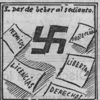
Obrar con legalidad. No ampararlos es crueldad.