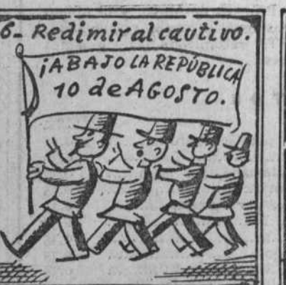
Y al cautivo, con fervor, rescatan y dan honor.