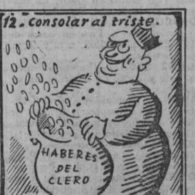
A estos pobres, que les den. Y que sea mucho y bien.