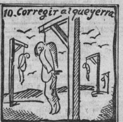
Pena de muerte tendrás, y así te corregirás.