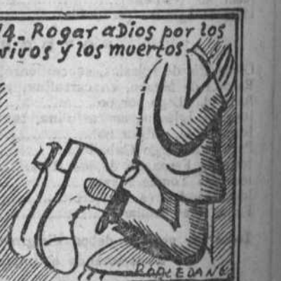
Esta es la santa misión de aquel que ame a su nación.