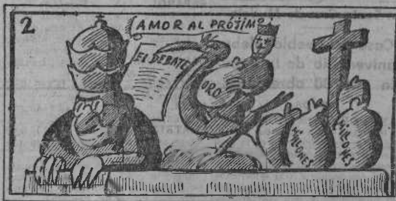
Bella carroza, sin pero, de "Los haberes del clero".