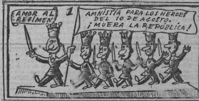
Carroza de "Honor y Euforia", que ha de pasar a la Historia.