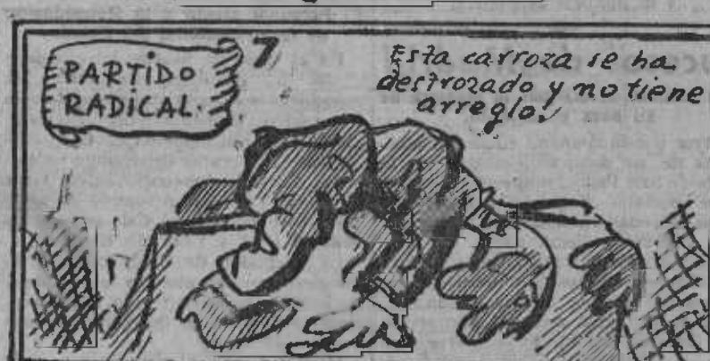
Te pongas como te pongas... no creo que lo compongas.