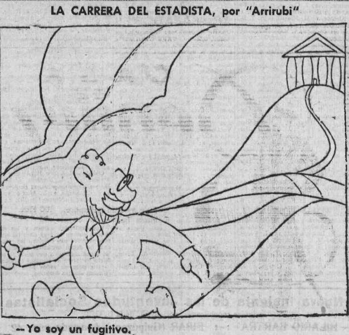
—Yo soy un fugitivo.

El manifiesto del Comité revolucionario fué ayer repartido profusamente Ayer fué profusamente repartido en Madrid por grupos de jóvenes republicanos el manifiesto que en diciembre de 1930 suscribieron los hombres en abril del siguiente año pasaron a formar parte del Gobierno provisional de la República.