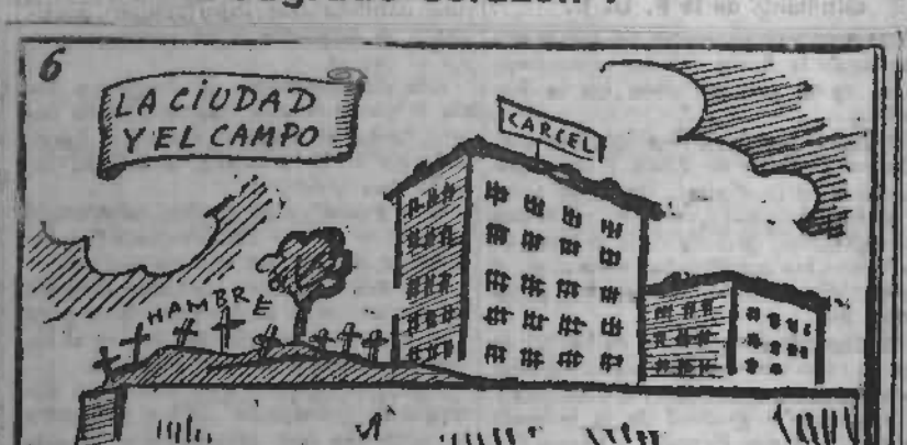
Carroza de "Paz y Amor" o "Premio al trabajador".