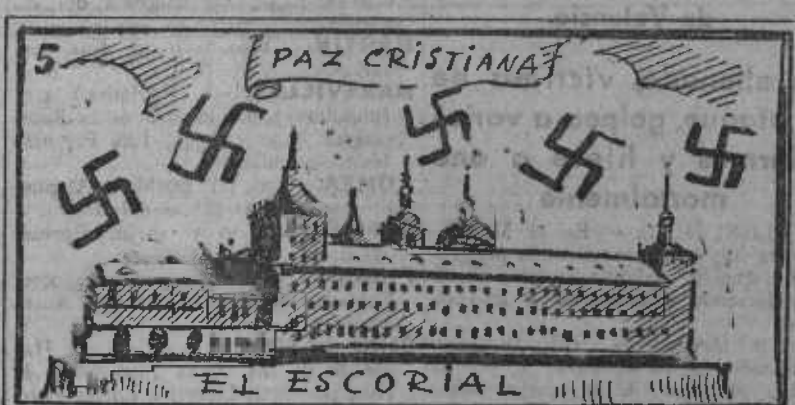
Carroza del festival que se hará en El Escorial.