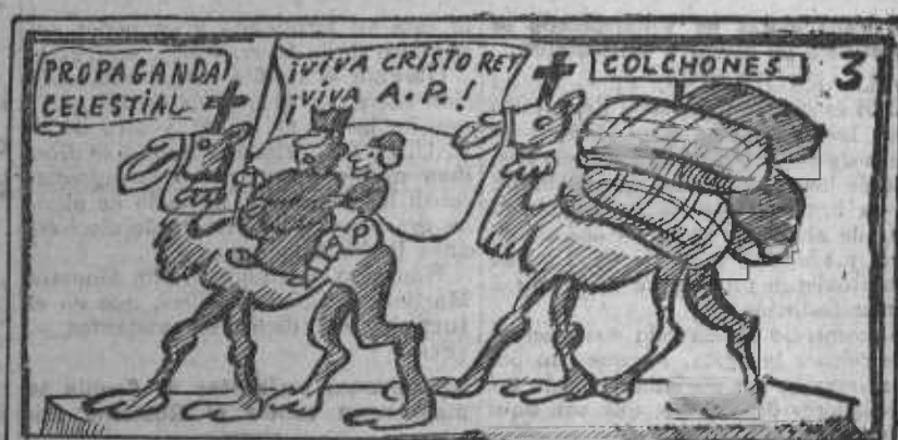
La "Religión y el colchón", o "El Sagrado Corazón".