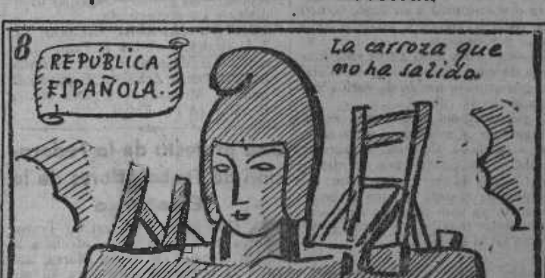
No la hemos podido ver, porque aun está por hacer.