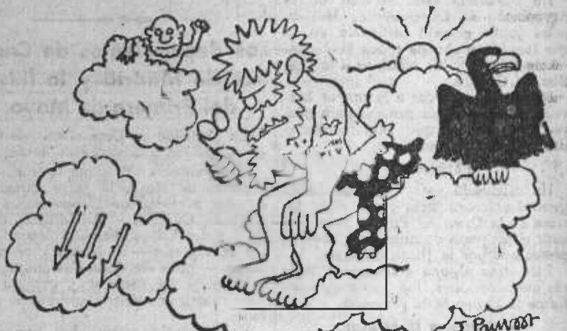
JÚPITER. — ¡Este Neptuno! ¡Encuentro su tridente en todas partes!

(Dibujo de Pruvost en Le Canard Enchaîné, París.)