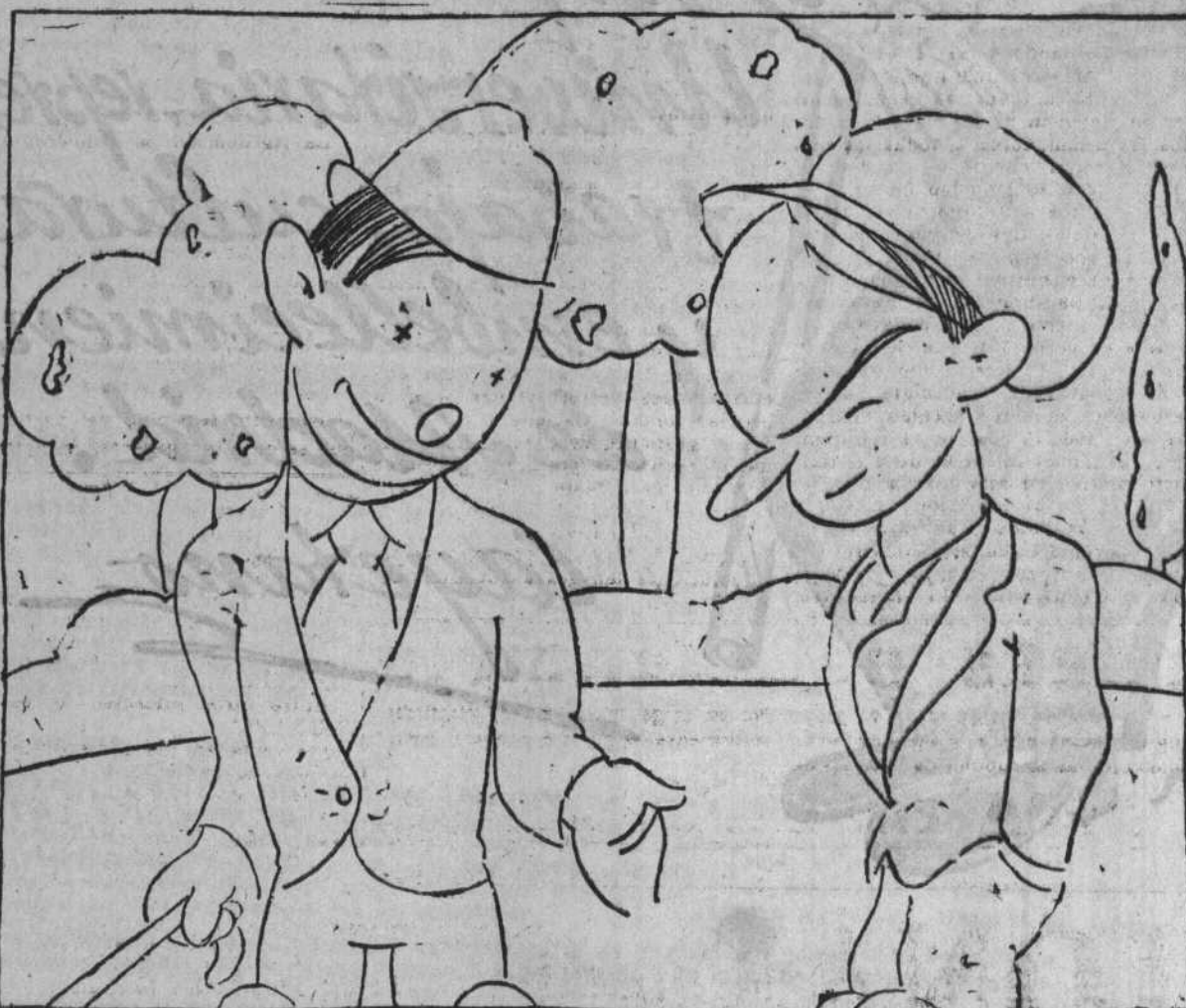
—Sí, claro: mal de muchos, consuelo de tontos.

Salazar Alonso ha dicho que no hay que preocuparse porque dure tanto la huelga de Zaragoza, porque ha habido otras que han durado un año.