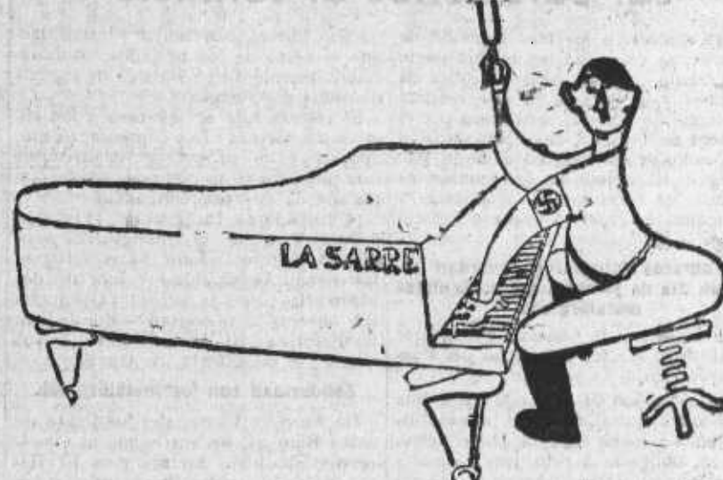
-- ¡Ya está a tono el Sarre! Ahora hay que ocuparse de Alsacia-Lorena. (Dibujo de Simplicius, Praga.)