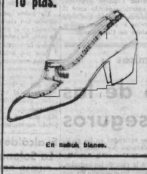
En nubuk blanco.