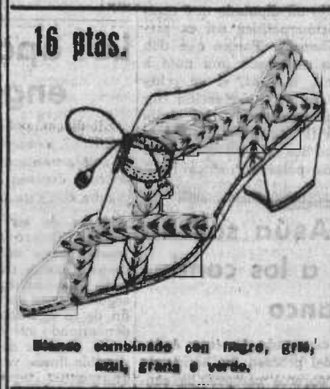
Blanco combinado con negro, gris, azul, grana o verde.