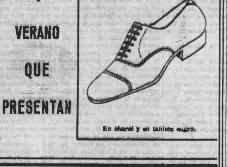
En charol y en tafetá negro.

ALMACENES PERPIÑAN ATOCHA, 61 (esquina a MATUTE) Avenida EDUARDO DATO, 7 (esquina a SILVA)