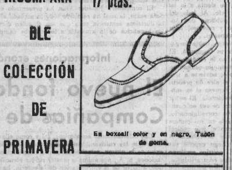
En boxall color y en negro. Tazón de goma.