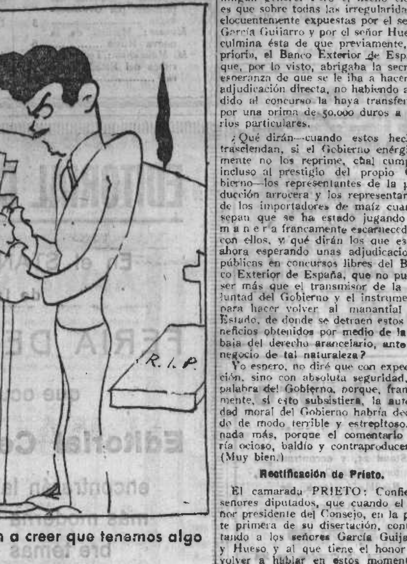
— Ya veréis cómo con la fama que tenemos se van a creer que tenemos algo que ver nosotros con esto.

LOS ENTERRADORES INGENUOS, por "Arrirubi" "O la República reduce a March, o March reduce a la República." (Palabras confirmadas por las declaraciones de Cambó.)