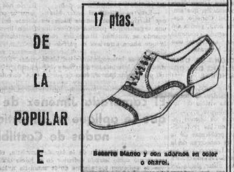
Blanco con adornos en color o charol.