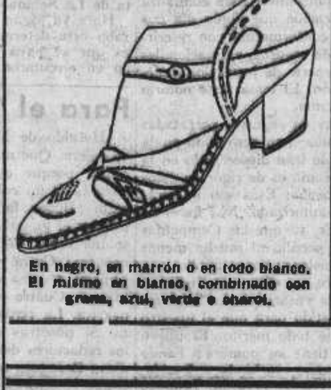
En negro, en marrón o en todo blanco. El mismo en blanco, combinado con grana, azul, verde o charol.