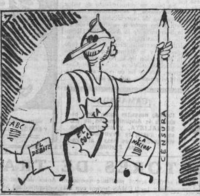
DOÑA ANASTASIA. (Barro) La Censura y su función, obra de la reacción.