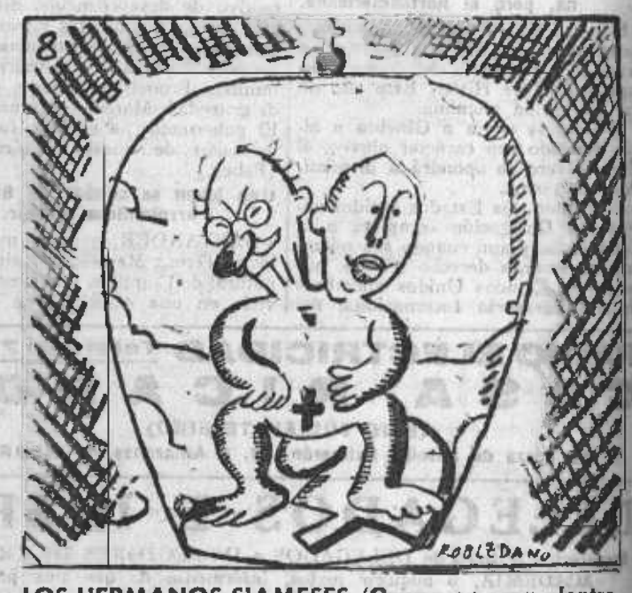
LOS HERMANOS SIAMESES. (Grupo en cera, dentro de un fanal) Esto bien claro lo ves: aunque sólo hay dos, son tres.