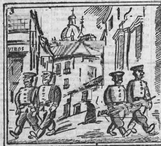
UNA CALLE MADRILEÑA. (Cuadro de costumbres) Pintura, justa y cabal, de una calle. Epoca actual.