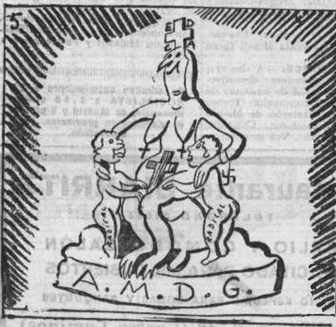
MATER AMANTISIMA. (Mármol de Italia) Obra que no has de olvidar, pues pronto la has de juzgar.