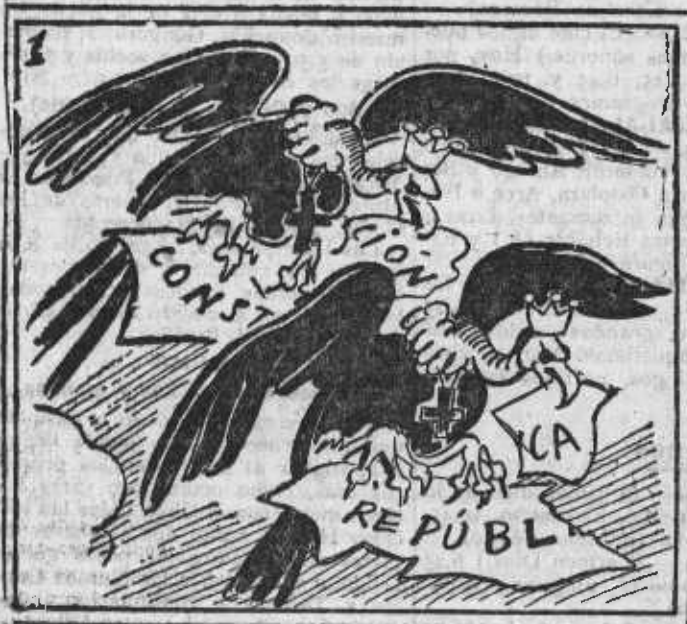
AVES DE RAPINA. (Pintura clásica) Con sus garras y sus picos todo van haciendo añicos.