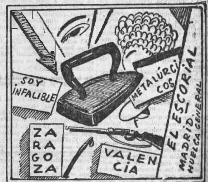
LA HUELGA. (Grabado cubista) De las planchas de este autor hay muchas pruebas, lector.