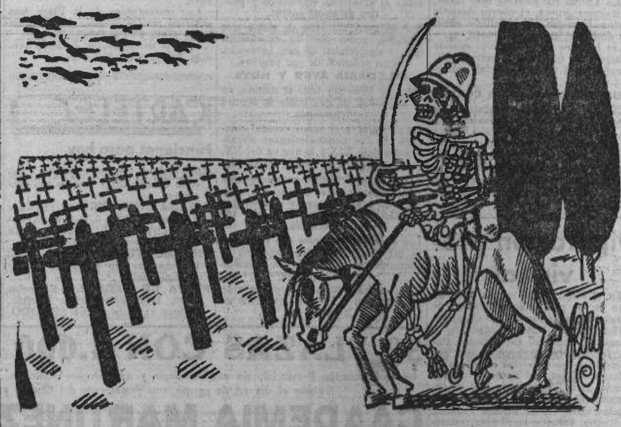
¡Arriba los muertos! ¡En pie para el desfile!

(Dibujo de Pedro en Le Casard Enchaissé, París.)