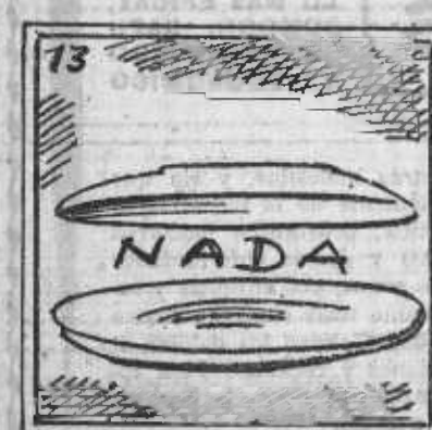
13. Y el Día rojo ha pasado, y todo igual ha quedado.