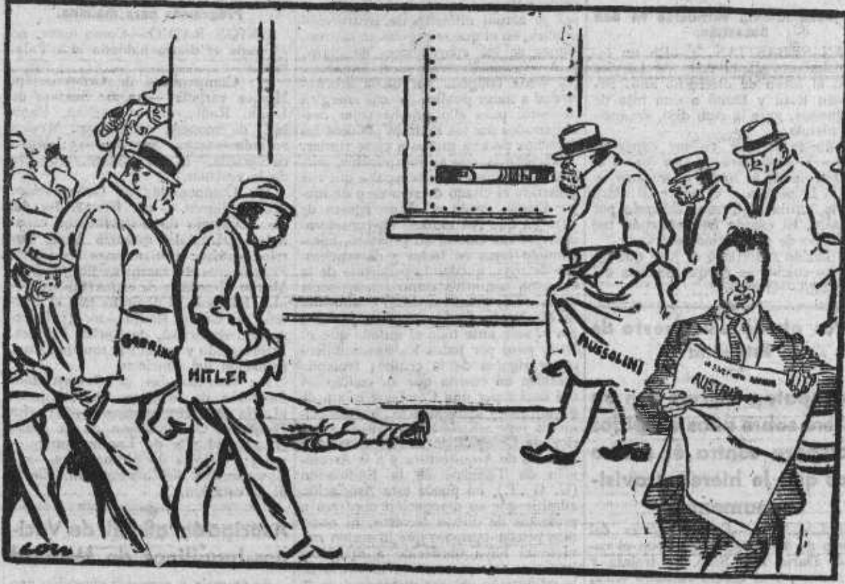
LA SOMBRA DEL BANDIDO DILLINGER.—El error mío fué no afiliarme al fascismo... (Dibujo de Low en «Evening Standard», Londres.)