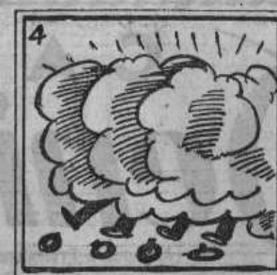
4. Una gran revolución amenaza a la nación.