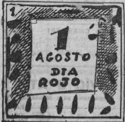
1. Día primero de agosto, la sangre llegará al rostro.