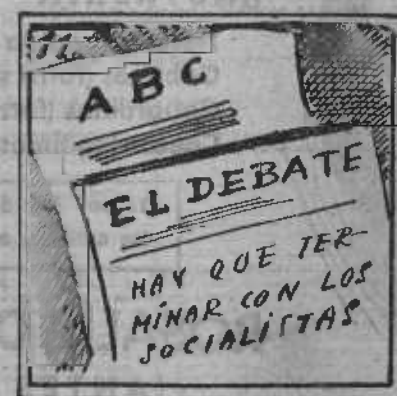
11. Las fuentes de información que rigen Gobernación.