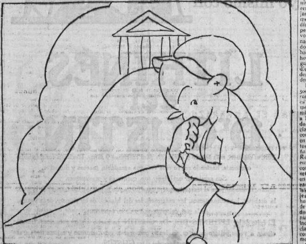
«Estoy «mosca». Va para un mes que no hay Cortés, y Alba «callao». ¿Qué preparará?»