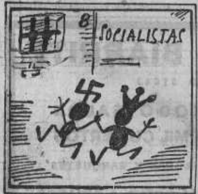
8. No hay que tener mucha vista que hay un complet socialista.