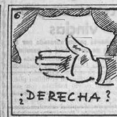
6. ¿Por la derecha será? Eso nadie lo creerá.