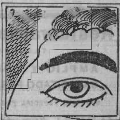
9. Ojo avizor precavido jamás hasta aquí ha existido.