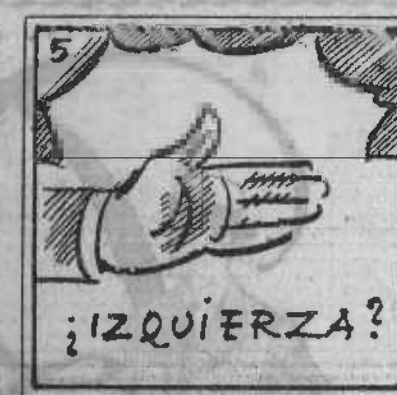
5. ¿Por la izquierda ha de venir? El no lo debe decir.