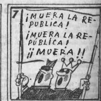
7. ¡Nunca tres cosas mal hechas no las hacen las derechas!