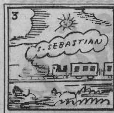
3. Si estará el asunto feo, que suspende el verano.