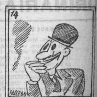
14. ¡Qué enorme, qué gran visión la que hay en Gobernación!