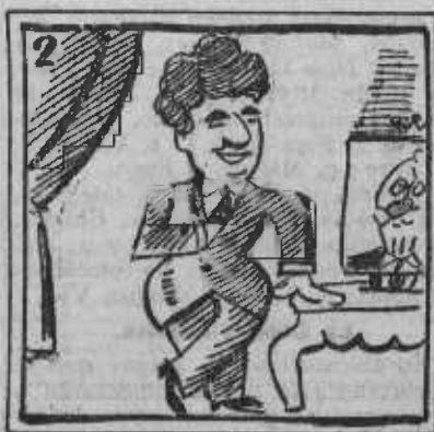
2. Cosa horrible ha de pasar, nos anuncia Salazar.