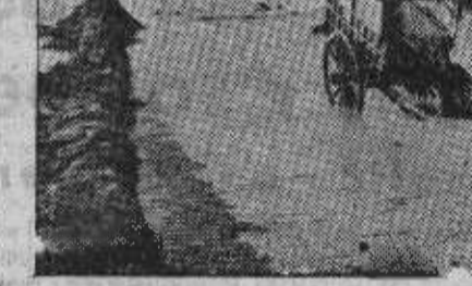
Una era inundada en Vega de Valdeironco

Después, entre sollozos temblones, cuenta una trágica y confusa historia.